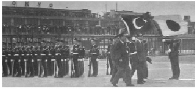
Adnan Menderes Japonya ziyaretinde Tokyo Havaalanında