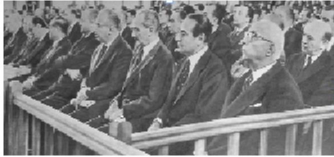
Celal Bayar, Adnan Menderes ve Demokrat Parti Bakan ve Milletvekilleri Yassıda duruşmalarında