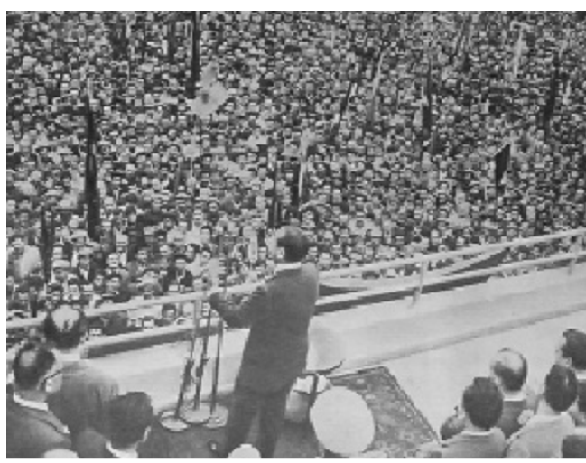
Adnan Menderes seçimi meydanında toplanan halka hitap ederken