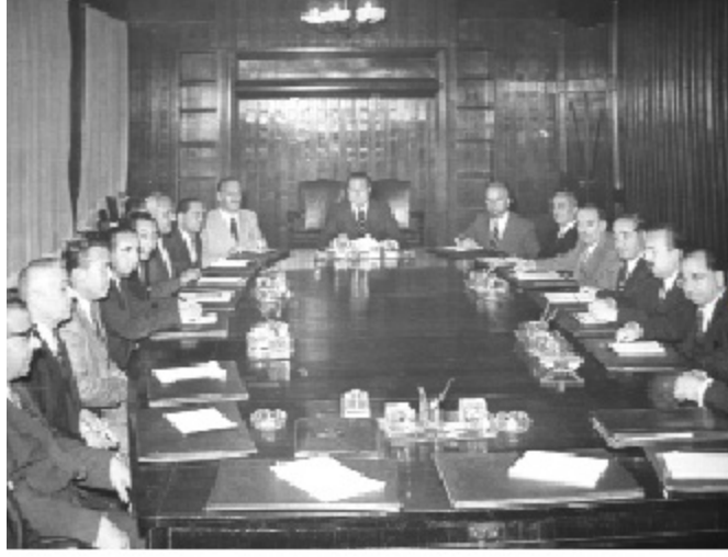
Demokrat Parti Bakanlar Kurulu

Temmuz ayında İsrail ile ticaret antlaşması imzalandı.