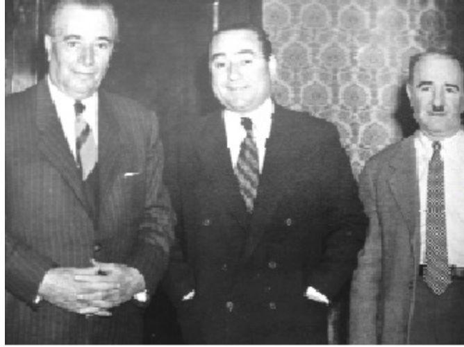
Refik Koraltan, Adnan Menderes ve Faat Köprülü