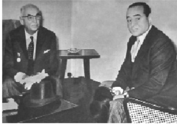
Celâl Bayar ve Adnan Menderes

“Bütçede sıhhat yoktur. Bütçede isabet yoktur. Milli politika herşeyden evvel, iktisadi teşkilatlanmak ve cihazlanmak işidir. İktisadi bünyesi kuvvetlendirilmeyen omuzlara yükletilen külfetler karşısında memleket iktisadiyatının gelişmesi şöyle dursun, gerilemesi mukadderdir. Maliyeci zihniyetiyle iktisadi kalkınma olmaz. İsrاف ve lüks, almış yürümüşür. Bütün memleketin, içinde bulunduğu ızdırap, bu hatalı tasarrufların neticesidir.”