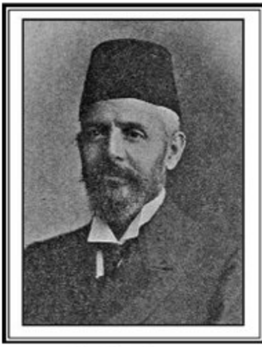
Selanik Mebusu Emmanuel Karasso