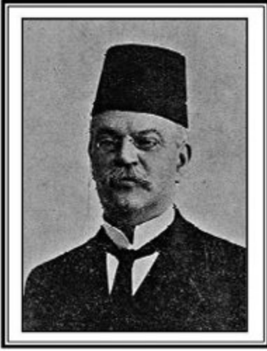
İstanbul Mebusu Vitali Faraci