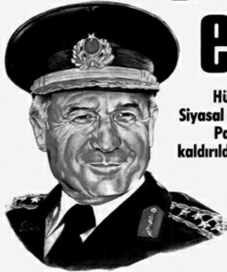
Genelkurmay Başkanı Evren - Genelkurmay ve Millî Güvenlik Konseyi Başkanı

Hükümet ve Parlamento feshedildi, Siyasal partilerin faaliyetleri durduruldu. Parlamentoların dokunulmazlıkları kaldırıldı. Saat 05.00'ten itibaren sokağa çıkma yasağı başladı