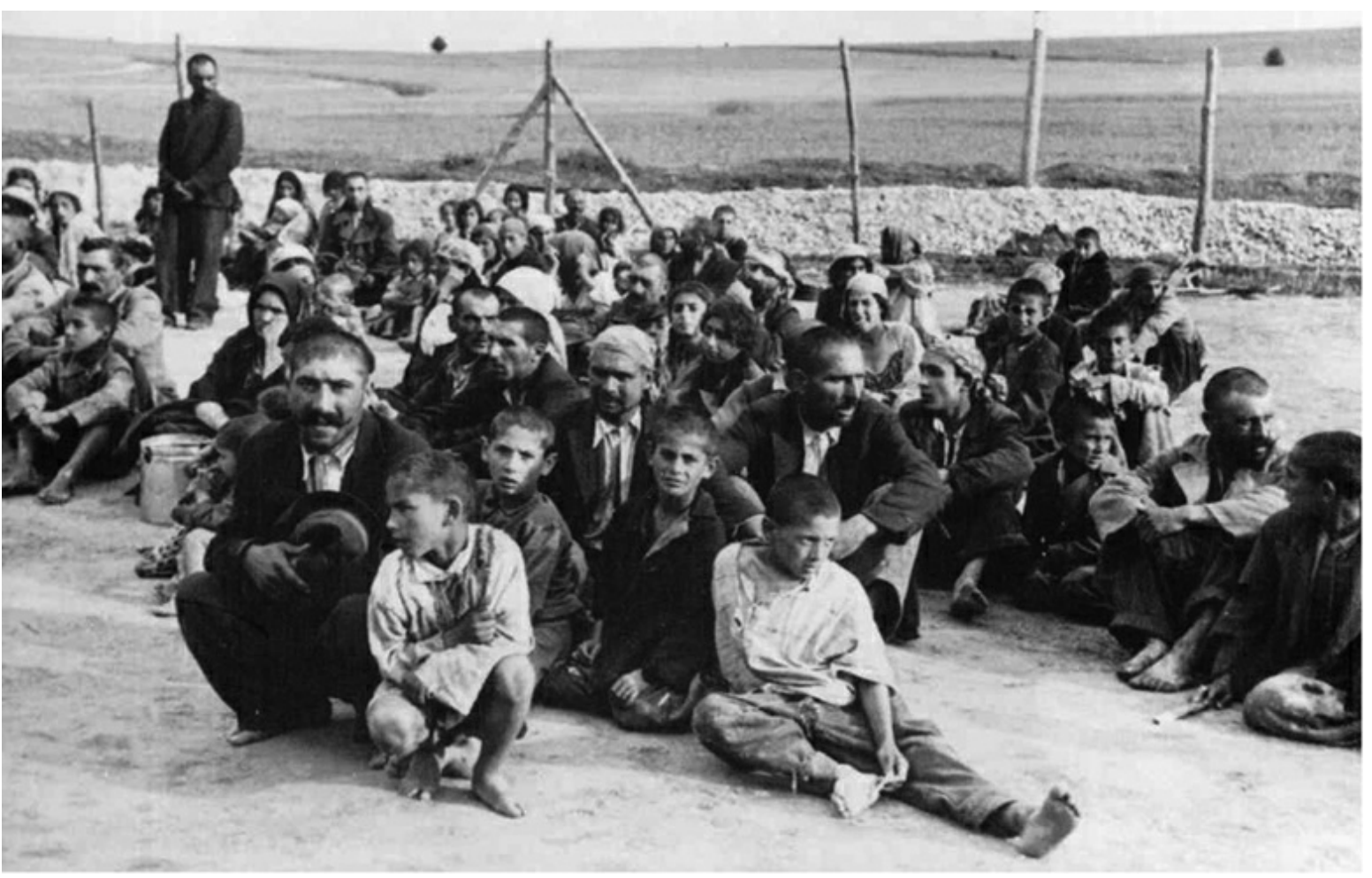
Sürgün edilen Kürtlerden bir grup

Bu dönemde Kürtçe konuşanlara, kelime başına beş kuruş para cezası kesilmiştir. Bu akıl almaz ceza ile ilgili anlatılan bir olay, meselenin boyutunu gözler önüne seriyor: