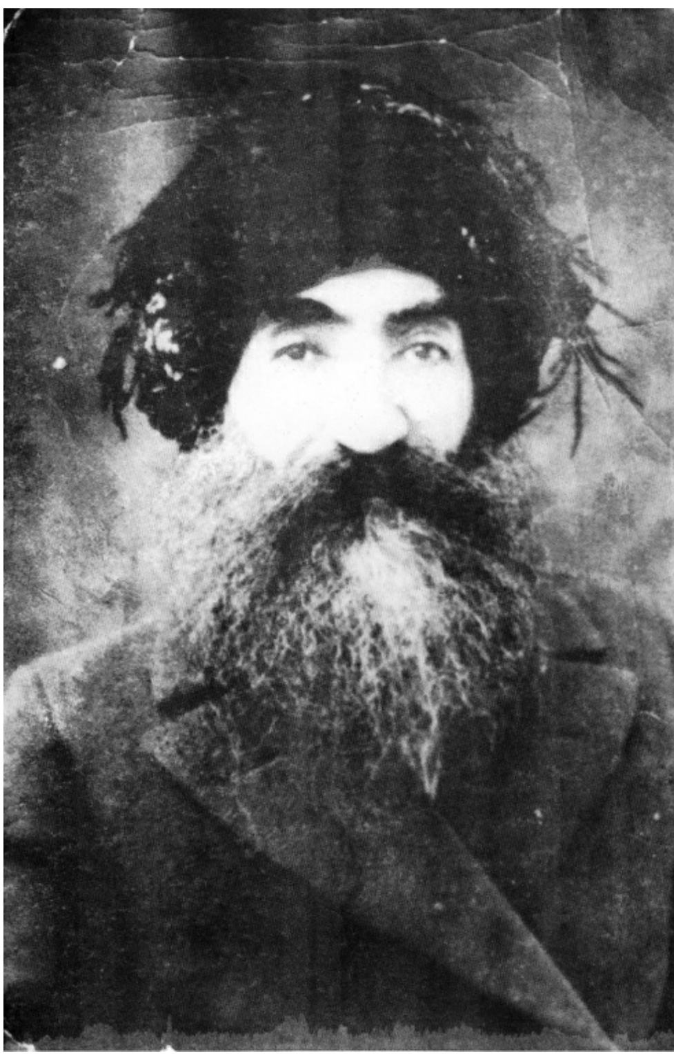
Dersim İsyanı'nın liderlerinden olduğu ileri sürülerek idam edilen aşiret lideri Seyit Rıza. (1863-1937)