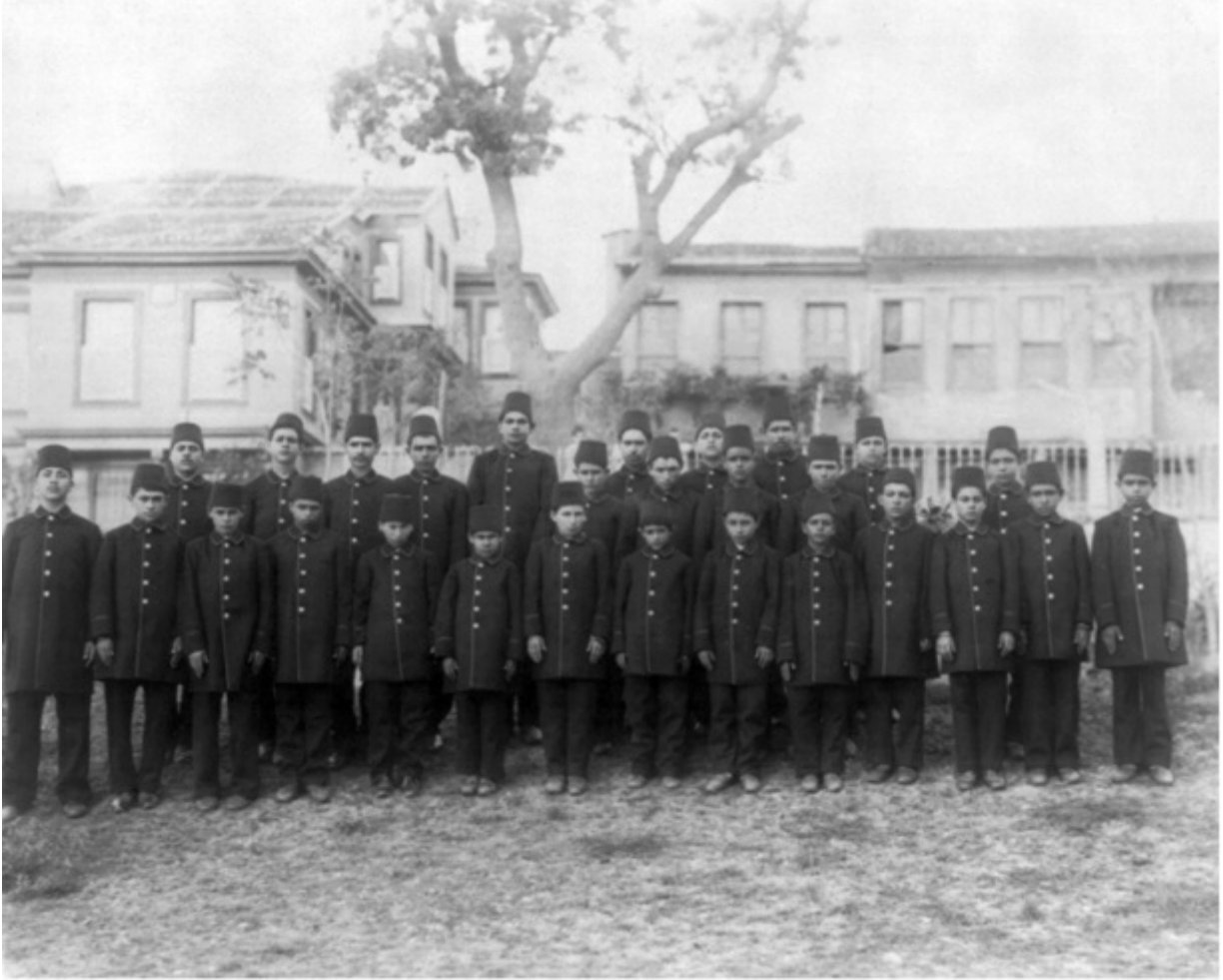
Aşiret Mektebi öğrencileri.

askeriye ve medeniyeye onları sevk etmesi' ifadelerini kullanmıştır. [27]