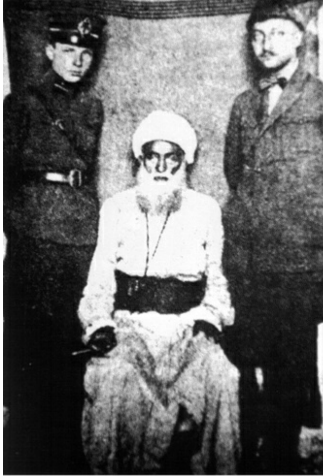
Zaza asıllı âlim Şeyh Said (1866-1925)

Şeyh Said, Nakşibendî tarikatının bu çevrede yayılması için büyük hizmetlerde bulundu. Erzurum, Ruslar tarafından işgal edilince buradan ayrılan Şeyh Said, ailesiyle birlikte Diyarbakır'ın Piran (daha sonra ismi Dicle olarak değiştirildi) ilçesine yerleşti. Şeyh Said, Kurtuluş Savaşı bitince de Hınıs'a geri dönmüştür.