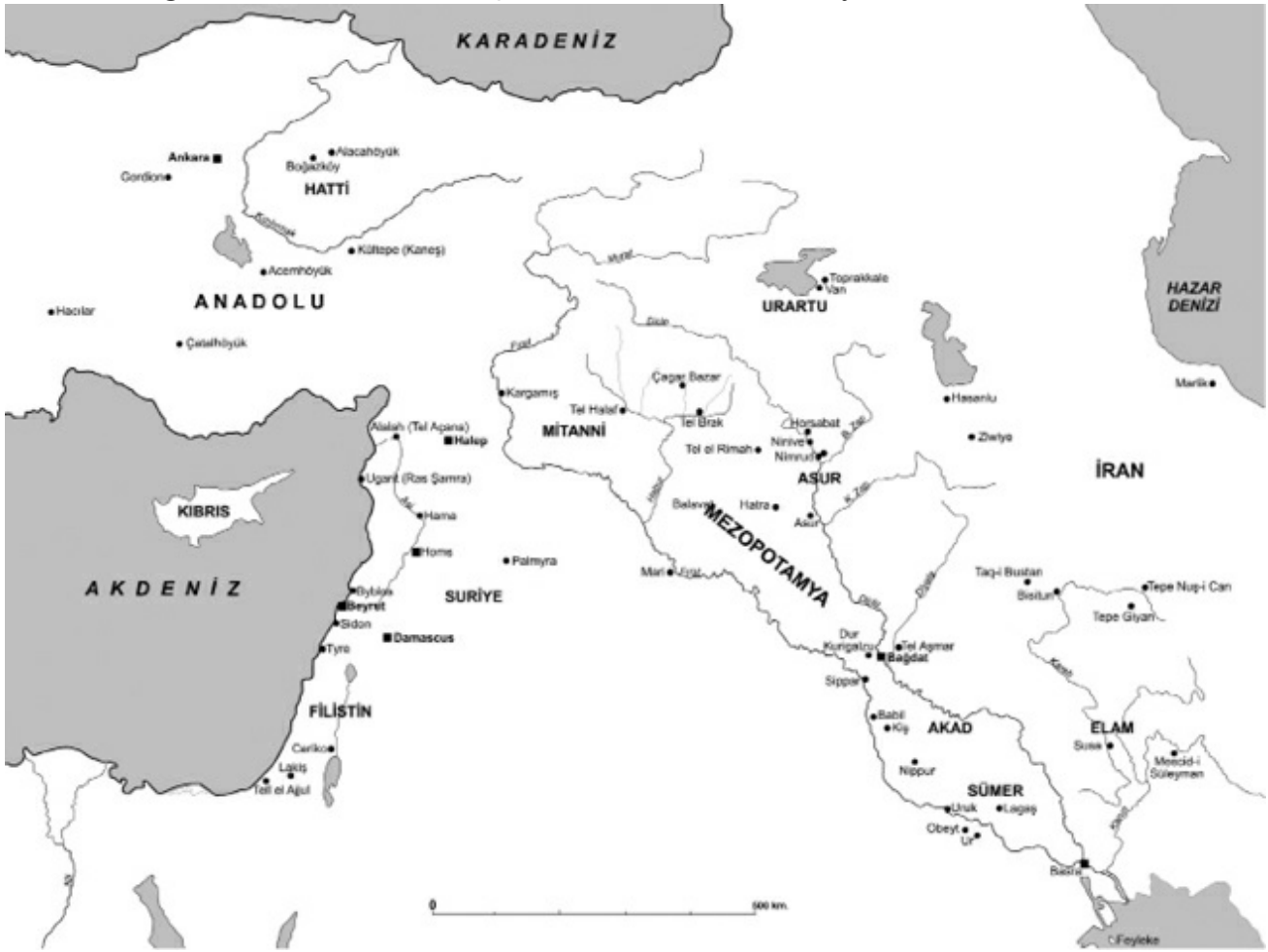
Eski Mezopotamya'ya ait bir harita

Bu bölümde Kürtlerin kökeni ve ne zamandan beri Mezopotamya bölgesinde oturduklarına dair herhangi bir bilgi verilmeyecektir. Bu konuda zaten çok da kesinleşmiş bir bilgi mevcut değildir. Bazı araştırmacıların ve tarihçilerin, Kürtlerin esas atalarının Guttiler ve Kardukalılar olduğu konusunda görüşleri bulunmaktadır. Bu konuda farklı ve birbirine zıt bazı iddialar da mevcuttur. Önemli ve kesin olan ise şudur: Kürtler binlerce yıldan beri bu bölgede yaşamaktadırlar. Göçlerle ve savaşlarla Kürtlerin yaşadığı bölgeye çok sayıda kavim gelip geçmiştir; fakat Kürtler burada oturmaya devam etmiştir. Bu nedenlerden dolayı, köklere inmekten ziyade mevcut durumu ve bazı tarihî gerçekleri ifade etmek daha doğru olacaktır. Bunun için de Kürtlerin İslâmiyet'i kabulü