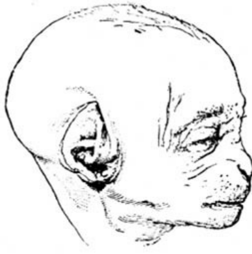
Bir orangutan dölütü ( fetus, cenin ). Kulağın erken çağıdaki biçimini gösteren bir fotoğrafının tam kopyasıdır.

kulağı resmini çocuğunun kulağı ile karşılaştırdı, ana çizgilerin çok benzediğini söyledi. Bu iki örnekte, kulak kenarı normal olarak içeriye doğru kıvrılıysaydı, içeriye doğru bir çıkıntı belirmeliydi. Başka iki örnekte, kulağın üst kesiminin kenarı normal olarak içeriye doğru – ama örneklerin birinde çok dar– kıvrılmış olmakla birlikte, kulak ana çizgileri bakımından gene biraz sivri kalmıştı. Resim 3, bir orangutan dölütü ( foetus, cenin ) fotoğrafının tam bir kopyasıdır. Bana Dr. Nitsche'nin gönderdiği bu resimde, sivrilmiş kulak taslağının, o dönemde, insanınki ile büyük bir genel benzerliği olan tam gelişmiş durumundan ne kadar farklı olduğu görülebilmektedir. Böyle bir kulak ucunun içeriye doğru kıvrılması ile kulak daha sonraki gelişimi boyunca büyük ölçüde değişmezse, içeriye doğru bir çıkıntı belireceği bellidir. Genellikle, bana öyle geliyor ki, söz konusu çıkıntılar, insanda da maymunlarda da, eski bir durumun kalıntıları olabilir.