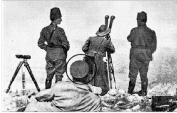
26 Ağustos 1922, Kocatepe’de Sovyet Komutanı