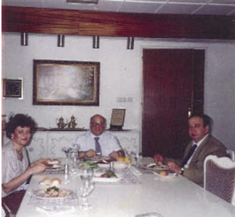
Başkan Denktaş, Manisalı ailesi ile yazlıktaki evinde.

Yemekte, ben kendi bilgi alanım içindeki hususları Başkan'a sunardım. Denktaş'ın yaptığı ilginç değerlendirmelerini, rahat ve "gayri resmi" bir ortamda dinlemek, özellikle "Türkiye'den gelen bir meraklı" için unutulmayacak değerlerde anlardı. Hele bu insanın içine "Kıbrıs virüsü" de girmişse, iş daha da ilginç oluyordu.