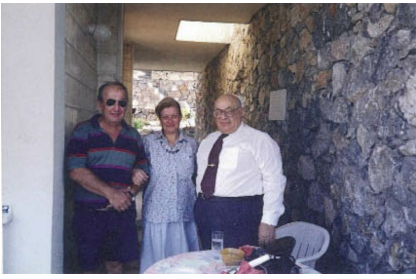
Denktaş bizi ziyarete gelmiş

İçinde acı, tatlı, alaycı pek çok şey var, ama hepsinde de örtülü bir siyasi bakış ve kara mizah gizli gizli kendini gösterir.