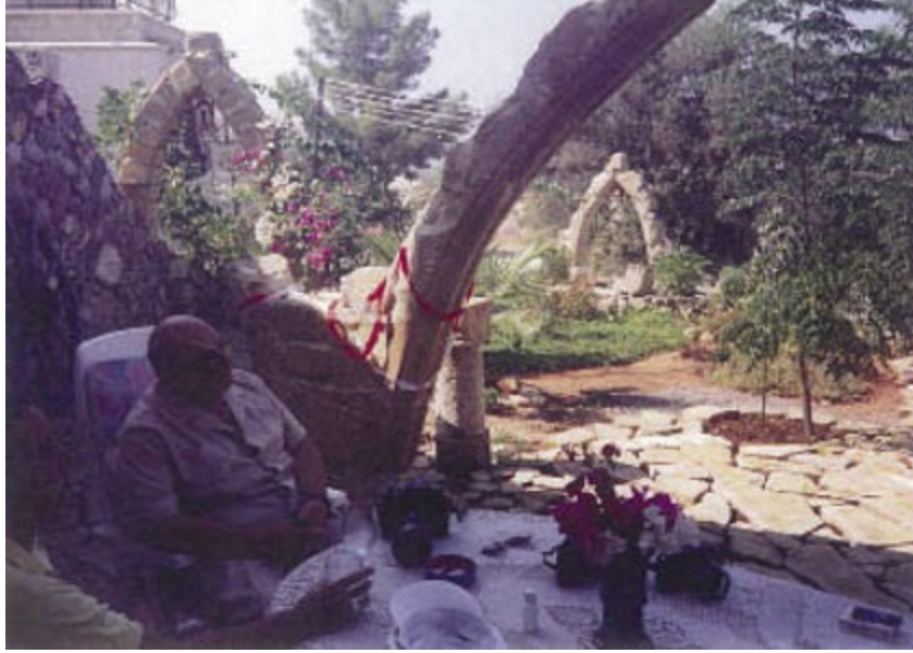
Rauf Denктаş, Erol Manısalı'nın tek başına yaptığı kemerlerin yanında. Başkan en büyük kemerin açılışını henüz yapmış.

Kuşlar renkliydi, kuşlar yumuşak ve nazikti, gürültü de yapmıyorlardı. İnsanı gerçekten dinlendiriyorlardı. O kadar yoğun, gürültülü ve çileli bir hayatta kuşlarla dostluk, onlarla yakınlık belki de bir kaçıştı. Sade, saf, temiz, rengârenk bir dünya. Gerçek dünyanın çirkinliklerinden, pisliğinden ve gürültüsünden çok farklı, huzura kaçış yolu.