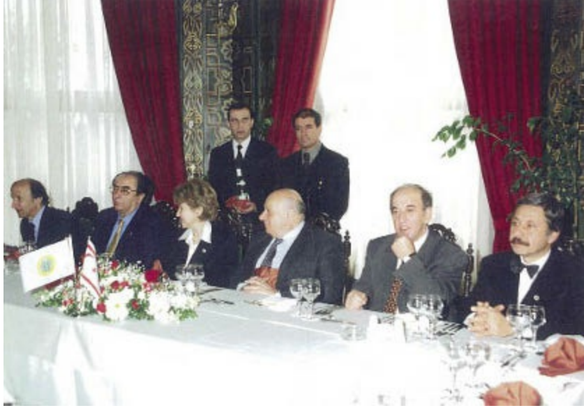
Denктаş İstanbul Üniversitesi’nde

Denктаş, 25 Şubat 1996 programının görüşmesi sırasında bana şöyle dedi: “Sen bilir misin, kaç fahri doktora bir tane gerçek eder?” Bunu tabii gülererek ve o ince mizah anlayışının içine oturarak söylüyordu. Onun sözü üzerine ben de güldüm. Aslında o, ne verilen doktorayı küçümsüyordu, ne de kendisinin fazlaca ödüllendirildiğini kastediyordu. Peki, ne demek istiyordu? Bence, sadece ve sadece, içindeki mizah duygusunu dışa yansıtmak için bir bahane arıyordu. İçindeki bu duyguyu açığa çıkarmak için belki de, ciddi, acı ve dikenli hayat yolunda, kendi içindeki sıcaklığı ve yumuşaklığı açığa vuruyordu.