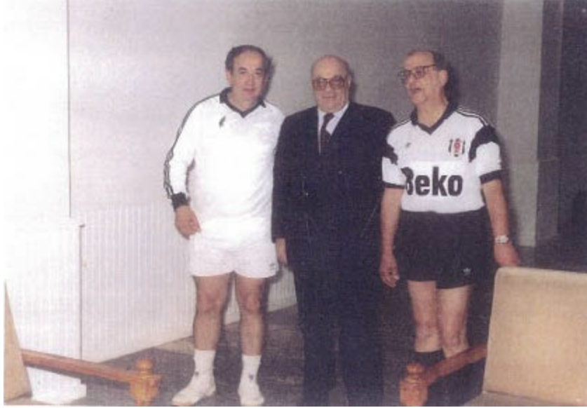
Erol Manisalı, Rauf Denktaş, Mümtaz Soysal

Denktaş'ın bana ilk sözü, "Yahu sizin kapıdaki adam beni tanımadı bile, Erol Manisalı diye sorunca eliyle işaret etti ve işine devam etti," oldu.