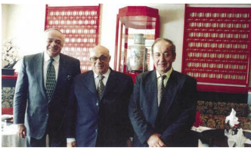
1997, Yeşilyurt Polat Oteli, Şarik Tara, Rauf Denktaş, Erol Manisalı

Benim açımdan Denktaş saygı duyduğum ve takdir ettiğim bir siyaset adamı olmanın yanında, samimi olarak fikirlerimi paylaştığım bir dost, bir aile büyüğü olarak göründü.