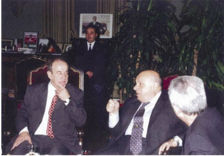
2001 İstanbul Üniversitesi, Erol Manisalı, Rauf Denктаş, Kemal Alemdaroğlu

Olayları yaşayan, yönlendiren, ter döken bir adamın öyküsüydü bu. Kıbrıs Türk Halkı'nın bağımsızlık mücadelesiyle özdeşleşmiş, iç içe geçmiş bir tarih, yaşayan adamın sözcükleriyle bir belge gibi, salonun içine düşüyordu.