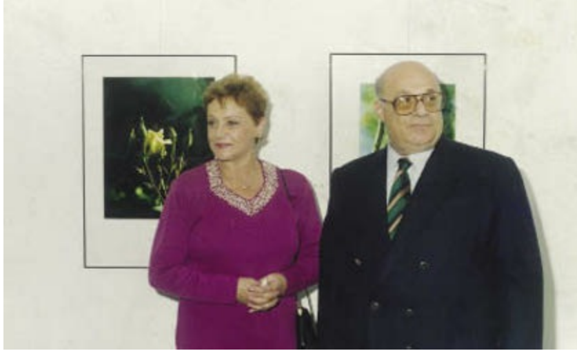
Rauf Denктаş eşi Aydın Denктаş ile birlikte.

Fotoğraflarında, insan-doğa-kültür dokusunu, Kıbrıs'a has unsurları ile çok net görürsünüz. Fotoğraflarını yan yana koyup baksanız, Kıbrıs Türkü'nün geçmişte çektiği sıkıntıyı yaşlıların derin çizgili yüzlerinde görürsünüz. Çocuklarda masumiyet ve iyimserlik hâkimdir. Kıbrıs'ın tarihî ve doğal dokusu ise çiçek, ağaç, deniz, cami, kemer ve ev fotoğraflarında bütün yerel özellikleri ile önünüze serilir.