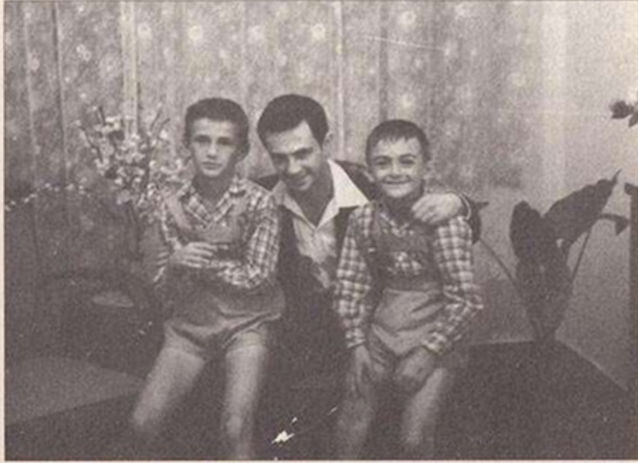
Yıl 1954. Üç kardeşin bir arada olduğu tek fotoğraf.