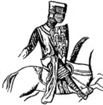
5. Louis; Philippe-Auguste'nin oglu, 1214.