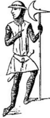
11. Gaucher de Joigny, 1211.