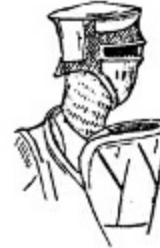
15. M. Thibauti Blois kontu, 1213.