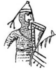
9. Jean de Corbeil, 1196