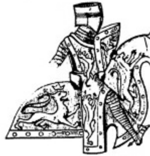
6. Savari de Mauleon, 1215.