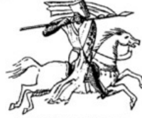
20. I. Philippe, Namur markisi, 1210.