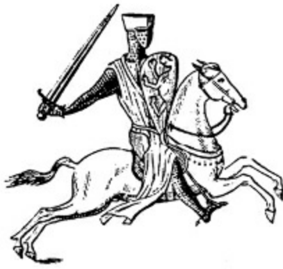
1. IX. Baudouin, Flandre kontu, sonra Konstantinopolis imparatoru, 1197.