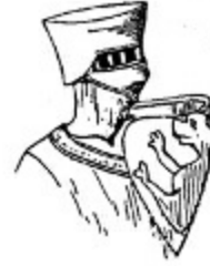
12. Louis Philippe- Auguste'nin ođlu, 1214.