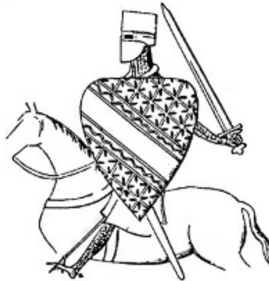
14. Champagne'de Firas kontu'nün mahkeme dyesi. 1226'ya dögrü.