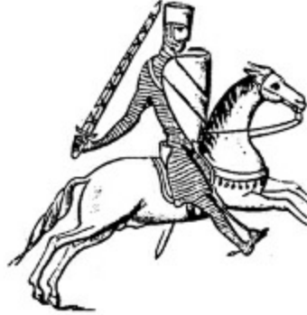
3. III. Thibaut, Champagne kontu, 1198.