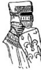
13. Guillaumme de Chauvigny, Châteauroux senyörü, 1217.