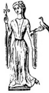
2. Marie de Champagne, XI Baudouin'in egi, 1202