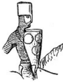
8. Pierre de Countenay, Nevers kontu, 1184.