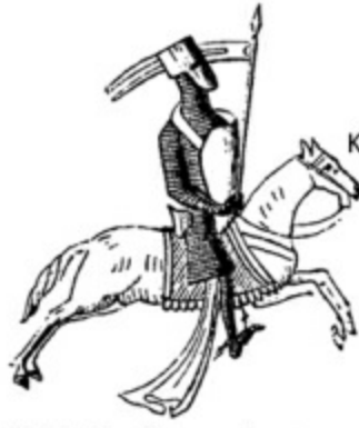
19. I. Arthur, Bretagne kontu, 1202