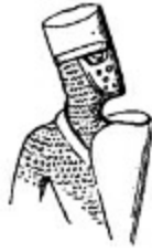
10. I. Arthur, Bretagne kontu, 1202.