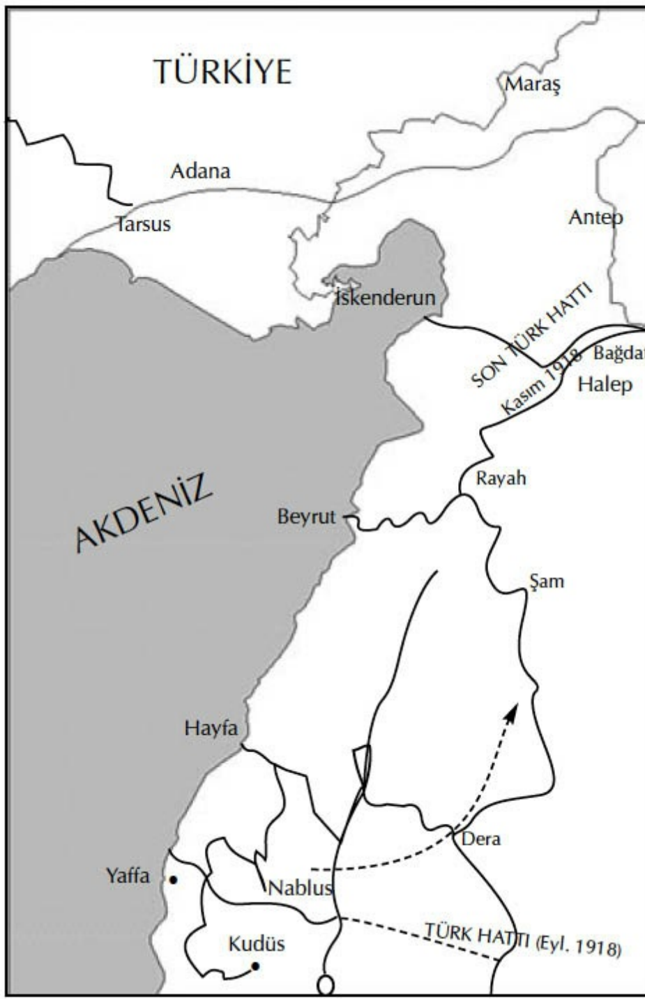
Harita (S.83) 1918 Suriye Seferi Haritası

Not: Bu haritada baskıdaki bozukluk nedeniyle kısaltılmıştır. Homs ve Hama'yı içeren Rayak ve Halep arasındaki bölge, haritada gözükmemektedir. Bkz. Genel Harita