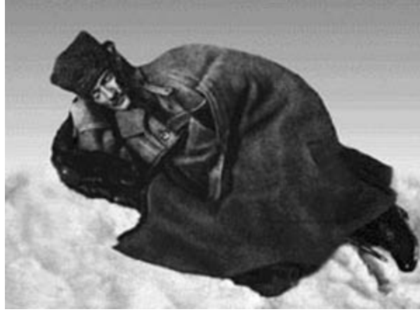
Sakarya Seferi sırasında Mustafa Kemal

Arkalarından son hızla Mustafa Kemal geliyordu, ancak, kısa sürede durmak zorunda kaldı. Türk ordusu yıpranmış ve bitmiş bir haldeydi. Etkili bir güç olmaktan çıkmıştı. İnsanüstü bir çabayla birkaç alay toplayıp yeniden düzenledi. Günlerce düşmanla teması kesmemek için yol aldı. Yunanlıları temmuzda yola çıkıp ilerledikleri ve Eskişehir'le demiryolu hattını kuşatan siperlerinde yakalamayı başardı. Onların karşısında bir hat oluşturup siper kazılması ve burasının korunması emrini verdi ve kendisi Ankara'ya koştu.