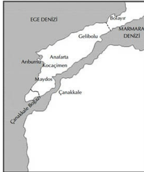
İngilizlerin ilerleme sınırı, 1915 Gelibolu Seferi Haritası

25 Nisan Pazar günü, İngiliz saldırısı başladı. Hafif bir sis denizin üzerini kaplamıştı. Sisin ötesinde büyük bir dalga halinde -savaş gemileri, destroyerler ve nakliye gemilerinden oluşan- çelik bir filo kayıp gidiyordu. Bir kesimi yarımadanın kuzeyindeki Bolayır'a saldırdı. Bu aslında, asıl hücum noktasını saklamak için yapılan bir askeri hilesiydi; ancak, von Sanders'i yanıltmaya yetti. Bir başka hileli saldırı da güneye yapıldı.