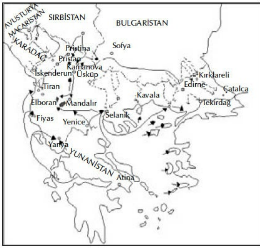
HARİTA: Balkan Devletleri'nin 1912-1913'teki I. Balkan Harbi'ndeki hücum hatlarını gösteren harita.

NOT: AA ve BB olarak işaretlenen hatların arası Türkiye'nin Avrupa topraklarının 1911'deki konumunu göstermektedir. CC işaretiyle İstanbul arasındaki küçük alan ise, savaştan sonra bu topraklardan Türkiye'ye kalan kısmı göstermektedir.