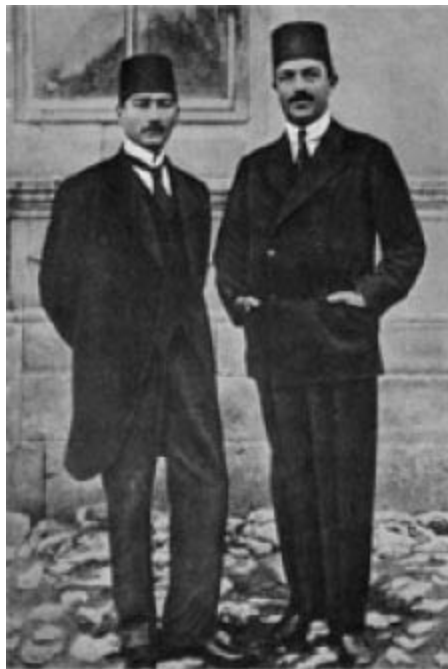
Mustafa Kemal Rauf Orbay ile birlikte.

Her ikisi de sağlam karakterli, her ikisi de tutkularınca yönlendirilen bu iki kişi arasında, ortak düşmanları olan Yunanlıların gidişiyle, kaçınılmaz olan rekabet artık başlamıştı. Hiçbir şeye bağlı olmayan devrimciye karşı tutucunun; sözde diktatöre karşı anayasal hükümet yanlısının, her şeyi kökünden söküp atmak ve yok etmekte kararlı kişiye karşı, geleneğe ve istikrarlı gelişme yanlısı arasındaki çekişmeyi bu.