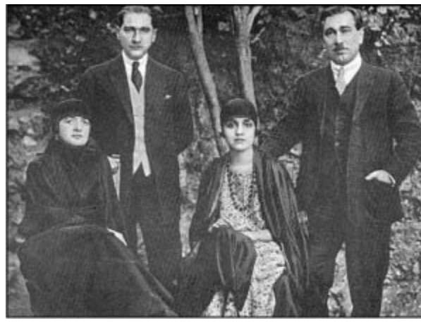
Mustafa Kemal ve Fethi Bey eşleriyle birlikte.

Orduya güvenemezdi. Doğu bölgesinde hocalar vaazlarında ona karşı bir kampanyayı kışkırtıyorlardı; Nasturiler ayaklanmış ve İngiltere Musul hakkında bütün saygınlığını temelinden sarsmış olan bir ultiatom vermişti.