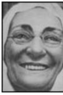
Zübeyde: Mustafa Kemal'in annesi