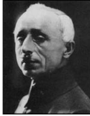
Albay Refet Bele

Bu yolculukta Mustafa Kemal hiç çekinmeden duygu ve düşüncelerini ortaya koydu. Hiç durmaksızın konuşuyor, görüşlerini, tutkularını, planlarını anlatıyor, içini döküyordu. Refet ise dinlemekteydi.