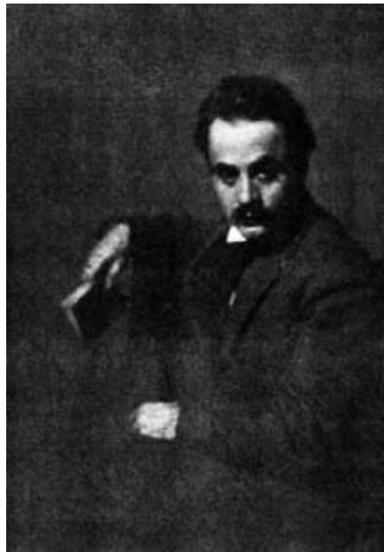
Cibran, 1920'lerin sonu.

1928'de Cibran'ın sağlığı kötüleşmeye başladı ve asabi ruh halinden kaynaklanan bedensel ağrısı iyice artıp, onu teselliye alkolde aramaya itti. Çok geçmeden, Cibran'ın aşırı içmesi ABD'de alkol yasağının zirvede olduğu bir zamanda onu alkolik yaptı. Aynı yıl ölüm sonrası yaşamı sorgulamaya ve Hıristiyan Karmelitler'in Bişerri'deki manastırında kendine bir mezar satın almayı düşünmeye başladı. Kasım 1928'de İnsanoğlu İsa (Jesus, the Son of Man) yayımlandı ve Cibran'ın İsa'yı yorumlama tarzından hoşlanan yerel basın tarafından olumlu eleştiriler aldı. Bu sırada Cibran sanat çevrelerinde büyük ilgi görüyordu. 1929'da onu davet etmeyen cemiyet yok gibiydi. Er-Râbitatü'l-Kalemiyye adlı cemiyet onun ilk dönem eserlerinin özel bir antolojisi edebi başarısının onuruna es-Senabil adıyla yayımladı.