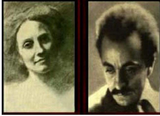
Mary ve Cibran

Mary'nin günlüklerinde Cibran ile ilişkisinin önemi ve anlamı ortaya çıkmaktadır. Cibran'ın sanatsal gelişimi, içten düşünceleri ve aralarındaki şahsi ve entelektüel sohbetler Mary'nin günlüklerine neredeyse onyediyi buçuk yıl boyunca kaydedilecekti. Bu kayıtlar Cibran'ın halktan sakladığı kişisel düşüncelerini ve ideallerini öğrenmek açısından büyük önem taşımaktadır.