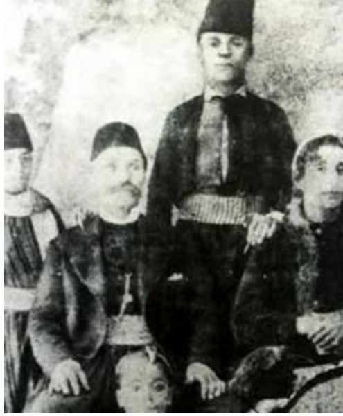
Bir aile hatırası

Lübnan, Büyük Suriye'nin (Suriye, Lübnan ve Filistin'i içeren) bir Türk eyaletiydi ve Lübnan Dağı bölgesine özerk idare statüsü tanımış Osmanlı hâkimiyeti altındaydı. Lübnan Dağı'nın halkı Osmanlı idaresinden bağımsızlığını kazanmak için yıllarca mücadele etmişti. Daha sonra Cibran da bu davayı benimseyip aktif bir üyesi olacaktır. Lübnan Dağı Hıristiyanlar, özellikle de Maruniler ile Müslümanlar arasında nefreti körükleyen çeşitli dış müdahalelerden dolayı sıkıntı yaşayan bir bölgeydi. Yaşamının sonraki dönemlerinde Cibran şahit olduğu dinsel bağnazlığı, zulmü ve gaddarlıkları ortadan kaldırmak için değişik mezhepleri birleştirme amacı güdecektir. Milattan sonra beşinci yüzyılda Bizans kilisesindeki bölünme sırasında oluşan Maruni mezhebi, kendi mezhepsel düşüncelerine önderlik etmesi için keşiş St.Marun'a katılmış bir grup Suriyeli Hıristiyandan oluşuyordu ve Cibran ailesi de bu mezhebe bağlıydı.