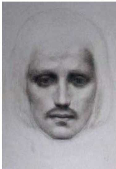
El Mustafa'nın yüzü

1918'de Cibran en ünlü kitabı olan Ermiş 'in tohumlarını oluşturan, "benim ada insanım" dediği nicedir üzerinde çalışmakta olduğu Arapça bir eserden söz eder Mary'e. Promethevâri bir adam olan El Mustafa adındaki bir kahinin 12 sene kaldığı Orphalese şehrinden ayrılıp, evine gitmek üzereyken bir grup halk tarafından durdurulması ve ana kahraman ile halk arasında insanlık ve hayatın genel durumu hakkında geçen konuşmalar kitabın içeriğini oluşturur. Günlüğünde Mary, Cibran'ın Ermiş 'le ilgili sözlerini aktarır. Sonraları Cibran bu kitap için "kariyerimin ilk kitabı, benim asıl kitabım, olgun meyvem" diyecektir. Bir başka yerde de " Ermiş , benim İsa'nın yüzünü yeniden yaratma çabamdır" diyecektir. Öte yandan Cibran İngilizce yazım konusunda hâlâ endişeliydi ve sürekli Mary'den öneri bekliyordu. Cibran "evrensel bir dil" yaratma konusundaki düşüncelerini yansıtan Süryanice İncil'in diline her zaman hayranlık duymuş ve çeşitli İngilizce yazılarında birleşik evrensel bir üslup oluşturmaya çalışmıştır.