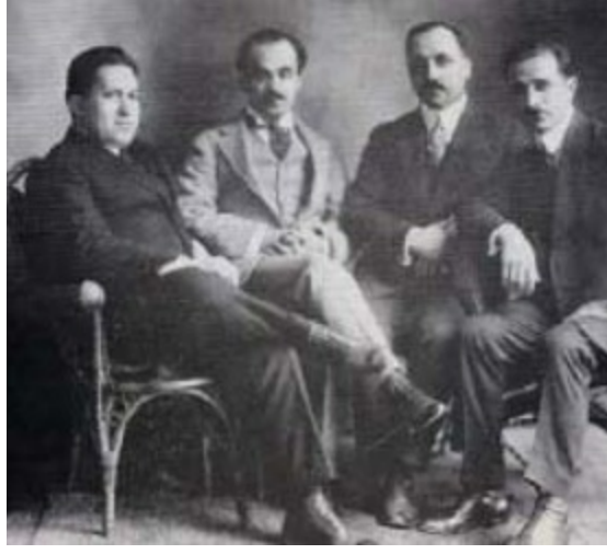
Pen Yazarlar Birliđi'nin bazı üyeleri, soldan sađa: Nesib 'Arıda, Halil Cibran, Abdülmesih Haddâd ve Mihail Nuayme, 1920.

Bu dönemde Cibran'ın Arapça yazımla meşgul olması onu Ermiş kitabını tamamlamaktan bir süreliğine alıkoydu. Dahası, popüleritesinin yaygınlaşması daha fazla yerde sanatsal sunum yapmasını gerektirdiğinden Ermiş 'i tamamlamak ile konuşma gezisi yapmak arasında bocaladı. Ne var ki kendini bütün zorluğuyla rağmen hem Arap dünyasının hem de İngiliz dünyasının sözcüsü olarak görmeyi sürdürüyordu.