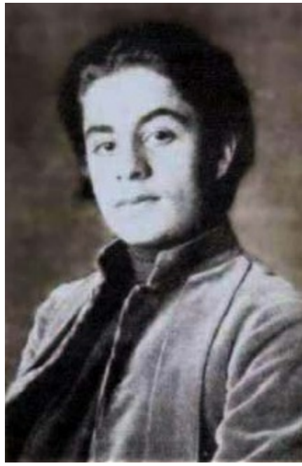
Cibran, Beyrut, 1898

Bir öğrenci olarak Cibran öğretmenlerin ve öğrencilerin üzerinde büyük bir etki bıraktı. Bireyci davranışları, kendine güveni, garip havası ve sıradışı uzun saçları herkesi etkilemişti. Arapça öğretmeni onda “sevgi dolu ama kontrollü bir kalp, kabına sığmayan bir ruh, asi bir zihin ve gördüğü herşeyle dalga geçebilen bir göz” olduğunu söylüyordu. Ne var ki okulun katı disiplinli havası, göze batacak şekilde dini vecibelerini aksatan, dersleri asan ve kitaplara eskizler çizen Cibran’ın hoşuna gitmedi. Arap dünyasındaki edebi hareketlerle de yoğun bir şekilde ilgilendi. Okulda Yusuf el-Huvayik ile tanıştı ve onunla el-Manara (Fener) adında bir dergi çıkardı. İkili derginin editörlüğünü yaparken, Cibran aynı zamanda illüstrasyonlar da yapıyordu.