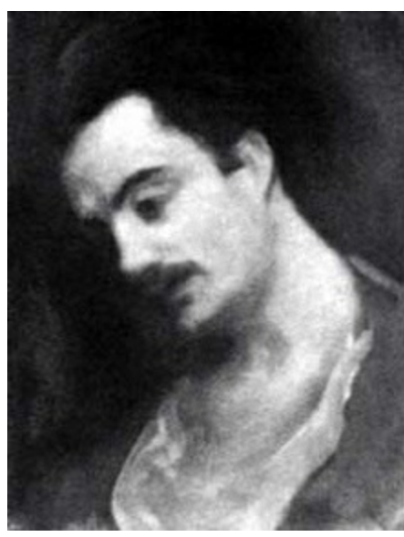
Cibran 25 yaşında, Yusuf el-Huvayik'in yağlı boya tablosu

Paris döneminde her hafta sonu Louvre Müzesi'ne gitmeyi ihmal etmeyen Cibran, İngiltere'de bir müzede saatlerce izlediği bir kadın heykelinden sonra müzeden çıkarken "o saatlerce izlediği kadın heykeline saygısızlık olmaması için kafasını yere eğerek ve gözlerini kısarak çıktığından" bahseder mektuplarının birinde.