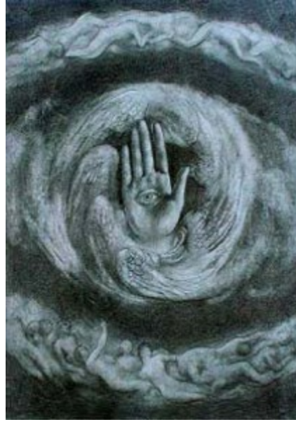
İlahi âlem, Cibran'ın resmi.

Mary ve Cibran Deli kitabını birlikte gözden geçirip hazırladılar. 1914'te Cibran beşinci Arapça kitabı olan Dem'a ve İbtisâme 'yi (Bir Gözyaşı BirTebessüm) yayımladı. 1904'ten bu yana değişik dergilerde yayımlanmış mensur şiirlerinin bir derlemesiydi bu kitap.