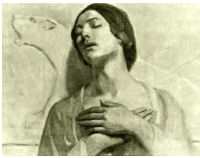
Annesi Kamile, Cibran'ın resmi

Yemyeşil otlarla kaplı Bişerri bölgesinde büyüyen Cibran yalnız, dalgın ve düşünceli bir çocuktur. Çağla-yanlar, sarp kayalar ve yeşil çayırların süslediği doğal bir çevre onun yazılarında ve çizimlerinde dramatik ve sembolik etkiler bıraktı. Ailesinin yoksulluğu nedeniyle resmi bir eğitim alamayan Cibran bir köy papazına düzenli ziyaretlerle eğitim hayatına adım attı. Papaz, öğrencisine Süryanice ve Arapça dillerinin yanı sıra dinin temel esaslarını ve İncil'i öğretiyordu. Cibran'ın meraklı ve uyanık mizacının farkına varan Papaz, ona alfabenin ve dilin esaslarını öğretmeye başladı ve tarih, bilim ve dilin kapılarını açtı. Cibran on yaşındayken bir kayalıktan düşüp sol omuzunu yaraladı. Bu kazadan sonra hayatı boyunca bu omzu hep zayıf kalacaktır. Ailesi çıkışı düzeltmek için omzunu bir haça sardı ve kırk gün sargılı bekletti. Hz. İsa'nın doğadaki gezintilerini andıran bu sembolik hadise hayatı boyunca Cibran'ın hafızasından hiç silinmeyecektir.