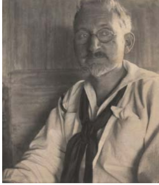
Fred Holland Day

yaşamış olan Cibran'ın özgüveninin yükselmesinde de rol oynadı. Tahmin edileceği gibi, Cibran çabuk öğrenen bir öğrenci olarak, zayıf Arapçasına ve İngilizcesine rağmen Day'ın kendine sunduğu herşeyi hemen öğreniyordu.