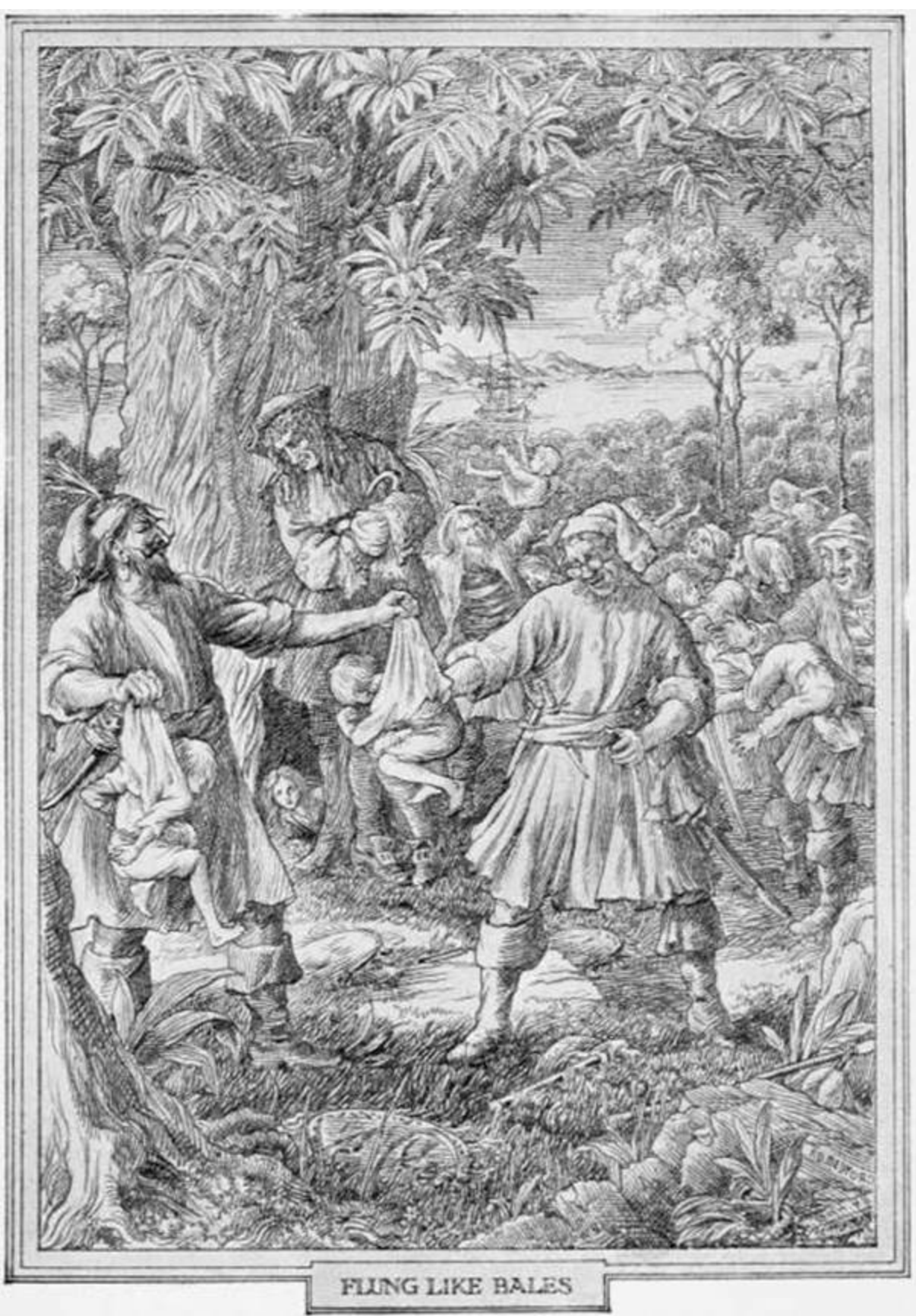
FLUNG LIKE BALES

Son olarak çıkan Wendy'ye ise farklı muamele edildi. Alaycı bir kibarlıkla şapkasını çıkararak kıza kolunu uzatan Kanca, diğerlerinin yığıldığı yere kadar ona eşlik etti. Bunu öyle seçkin bir tavır sergileyerek yaptı ki, Wendy bağıramayacak kadar etkilenmişti. Ne de olsa, küçücük bir kızdı o.