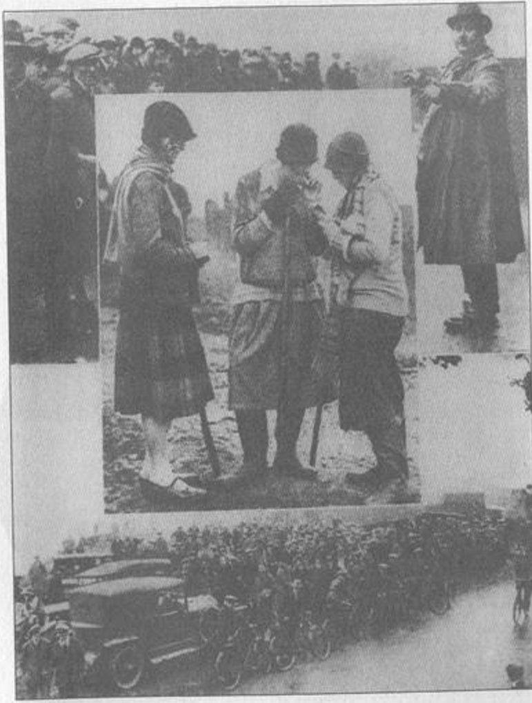
Westminster Gazette 'de basılan 12 Aralık 1926 tarihinde düzenlenen "Büyük Pazar Avı"ndan sahneler. En üstte: Surrey Polisi'nden, araştırmayı yöneten, Agatha'nın öldürülmüş olduğuna inanan Polis Şefi Kenward