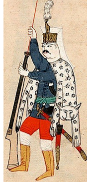
Tüfeğini temizleyen Yeniçeri

taşırılar. 78 Bunlar yeniçerilikten yetişmiş ve bu üst kadrolara çıkmış olarak ocağın yönetiminden birinci derecede yetkili ve sorumluydular. Yeniçeri Efendisi de denilen Yeniçeri Kâtibi Yeniçeri ve Acemi ocağının maaş ve esâme kayıtlarının tutulduğu kalemin âmiri ve Ağa Divânı'nın üyesi olarak, buradaki davalarda yargılama görevini üstlenir. Bu özelliklerinden ötürü Katar Ağaları kadar önem taşır ve diğerlerine takaddüm ederdi.