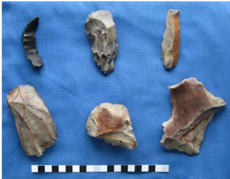
MOUSTERIAN ALET TAKIMI

ar sadece sosyal hayvanlar değil, aynı zamanda özellikle bu amaçla büyütülmüş ve iş beyne sahip aşırı derecede sosyal hayvanlardır.