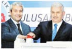
Siber Güvenlik Tatbikatı toplantısında Bakan Nihat Ergün ve Bakan Binali Yıldırım katıldı.

Teknoloji Bakanı Ergün ise sustarı söyledi: "YÖK'e yapılan siber saldırı, tatbikatların ne kadar önemli olduğunu gösterdi. YÖK, bu tatbikata katılmayan kurumlardan biri. 3 gün önce böyle bir saldırıyla karşı karşıya kalırdı. TÜBİTAK'taki Siber Güvenlik Enstitüsü'nde 70 kişi görev yapıyor. İlerleyen günlerde kapasite 200'ün üzerine çıkacak. Tatbikata 61 kurum katıldı. Bu sayı az. Bir söz var: 'Bir musibet, bir nesihatten evladır' diye ne zaman kimin nerede saldırıya uğrayacağı belli değil."