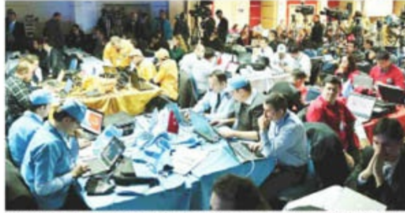
194 personelin katıldığı tatbikat iki hafta sürdü. 4 takıma ayrılan ekipler siber saldırılar düzenledi.