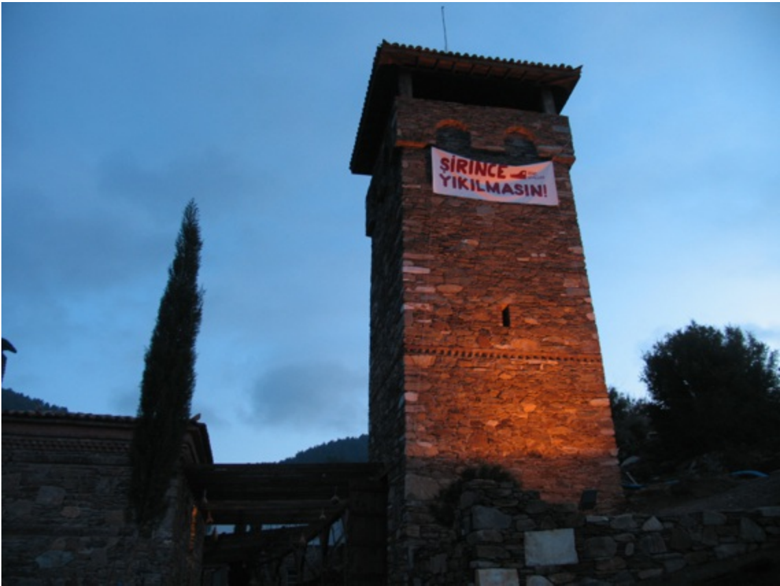
(Hodri Meydan Kulesi)

Kulemiz 3.90'a 3.90 bir kare, 9.60 yüksekliğinde. İçeride minare gibi helezoni 44 basamaklı bir merdiven, tepede 15-20 kişinin sığacağı terası var. Manzarası muhteşem. Tüm Şirince'yi, etraftaki üç vadiyi, Matematik Köyünü, benim kaya mezarını, uzaktan Keçi Kalesini görüyor.