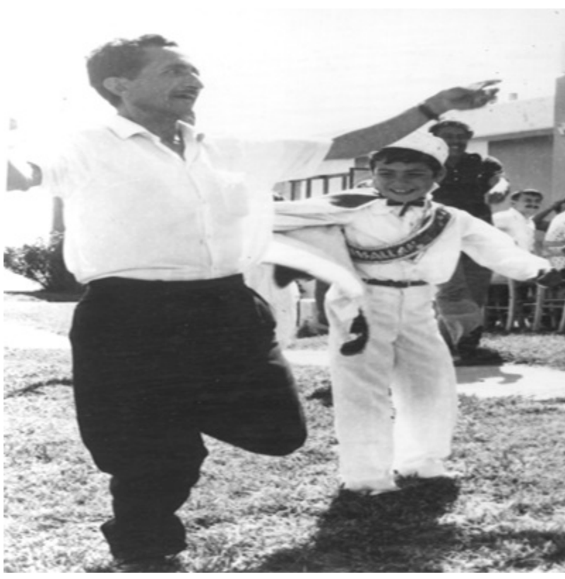
İzmir (1974 yazı)