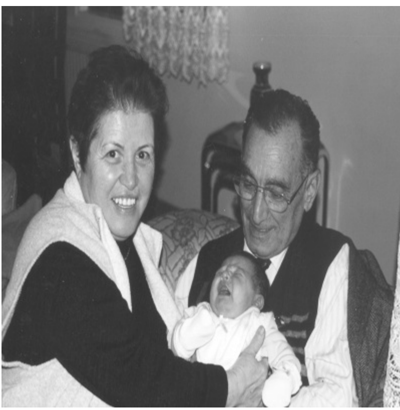
İzmir (Kasım 2000)