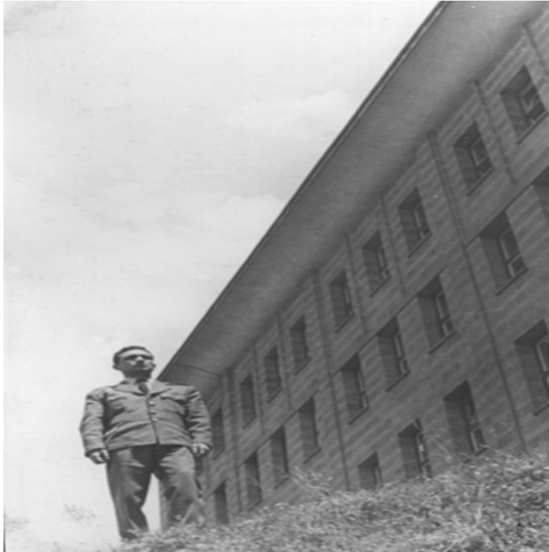
DTCF (20 Ocak 1961)

1960'ta mezuniyet imtihanında bölüm birincisi olarak okulu bitirir ve teğmen rütbesiyle Hava Kuvvetleri'nde göreve başlar.