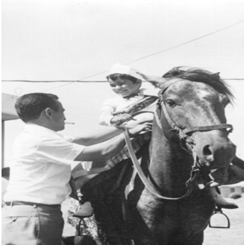
Çiğli, İzmir (1974)