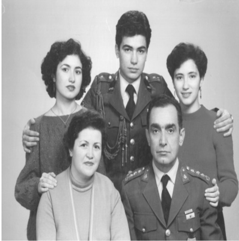
İzmir (Şubat 1985)

İki yıl sonra tayini İzmir Maltepe Askerî Lisesi’ne çıktı. 1985’te omzunda daha fazla yer kalmadığı ve daha alt devre bir kurmay subay okul komutanı olarak atandığı için, ailedeki herkes karşı çıkmasına rağmen emekli oldu.