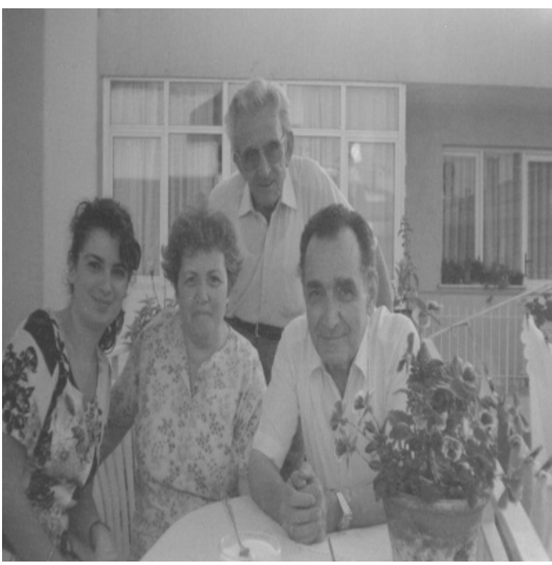
Reşadiye, İzmir (1995-1996)