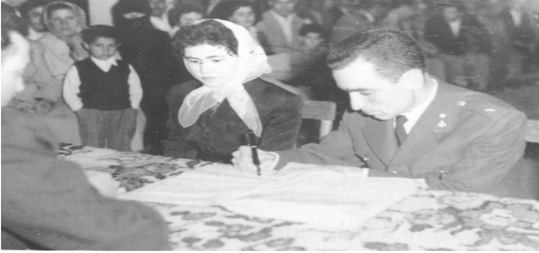
Demirci Belediyesi Nikâh Salonu (18 Eylül 1960)

1959'da annemle nişanlanırlar. Nişan hikâyeleri ilginç. 1960'ta evlenirler.