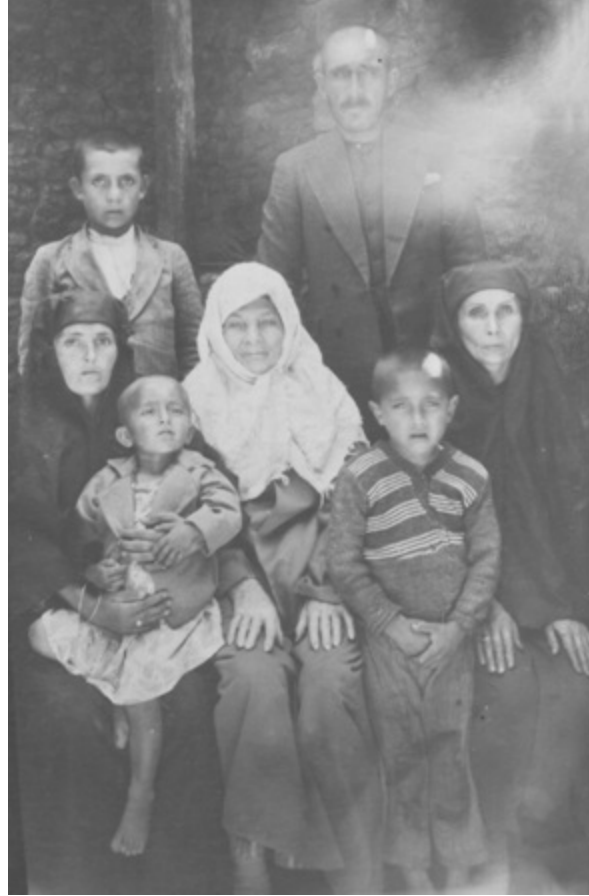
Demirci, Manisa (1934 olmalı)