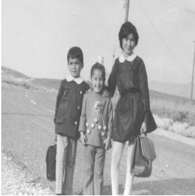
Çiğli, İzmir (1973)

Televizyon yok, teknoloji yok. Belki de bu yüzden çocuklarına çok vakit ayıran bir ana baba. Üç iyi geçinen kardeş.