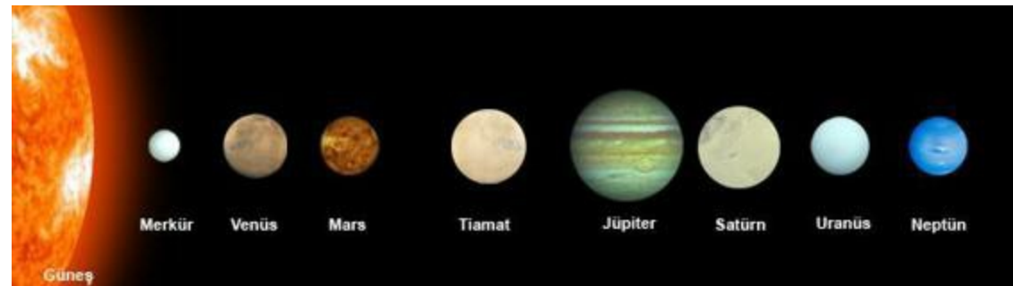
Şekil 2. Ay'ın kökeni, Plüto'nun kökeni ve Tiamat'ın bölünerek Dünya'yı oluşturması ile ilgili çalışma Şekil 3. Tiamat'ın ikiye bölünerek büyük parçanın Dünya'yı oluşturmadan önce Güneş Sisteminin elemanları

Satürn'ün halkası daha Tiamat yok edilmediği için mevcut değil. Satürn'ün bir uydusunu aldık ve o uydu dahil olmak üzere Nibiru'nun bütün uydularını (toplam 7 adet) doğruca Tiamat'ın ortasına gönderdik. Sonra, füzyon jeneratörlerinin bulunduğu pozisyona geldiğinde, bir lazer ışını gönderdik.