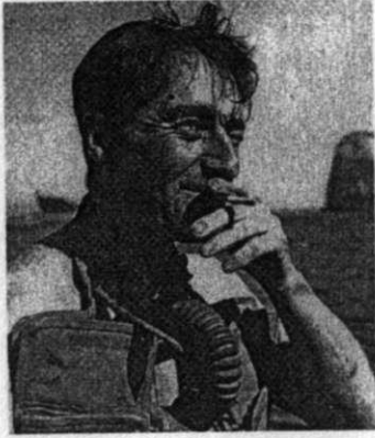
Lionel Buster Crabb. Ünlü kurbağa adam, ajan. James Bond ondan esinlenerek kurgulandı.