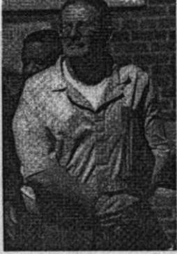
Aldrich "Hazen" Ames. CIA üst düzey yönetici, 1963'te Ankara'da casustu. 1993'te Ankara'dan ABD'ye dönmönce KGB ajanı olarak tutuklandı. Halen müebbet cezasını çekiyor.