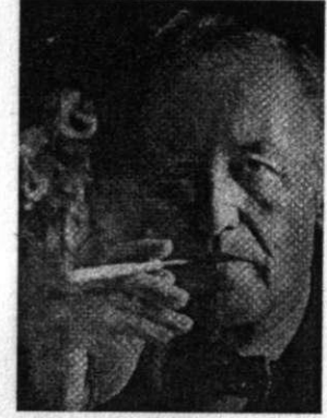
Kim Philby. İngiliz gizli istihbaratını çökerten KGB ajanı. İstanbul üzerinden Moskova'ya kaçırıldı.