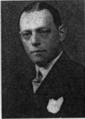
Oswald Rayner. Rasputin'i öldüren İngiliz ajanı. (1909)

CIA'nın kurdu u AKIN Binası. (Amerikan Kürt Enformasyon a 1). Washington DC. (2004)