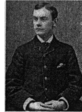
Haynes'in gençli i.