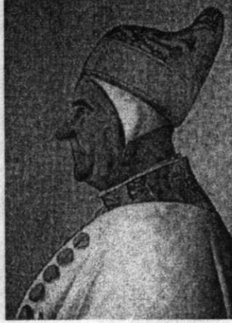
Bruno'yu ihbar eden Mocenigo Hanedanı'nın kurucusu Venedik Dodge'u.