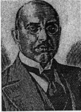
Max Ervin Scheubner Richter. Birinci Dünya Sava rında Erzurum'daki Alman ajan. Hitlerin dostuydu.