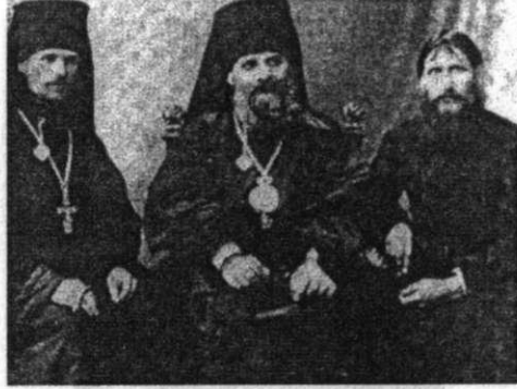
Rasputin sanıldı ı gibi cahil bir papaz de ildi. Foto rafta onu (sa da) Rus Ortodoks KİLsesi'nin ba ı Piskopos Üiodor ve Piskopos Hermogen ile görüyorsunuz.