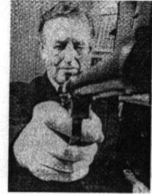
Philby, Moskova'daki evinde.