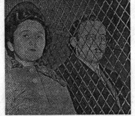
Ethel ve Julius Rosenberg. KGB ajanları. Birlikte idam edildiler.