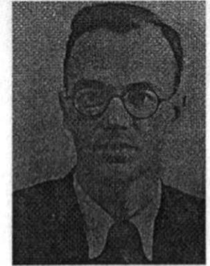
Dr. Klaus Fuchs. KGB ajanı Rosenberg olayına kansü.