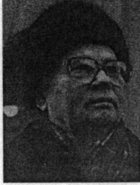
Vladimir Kryuchkov. KGB 'nin güçlü başkanı. Gorbaçov 'a karşı darbe düzenledi. 1988'de bir görüşme yapmıştım.