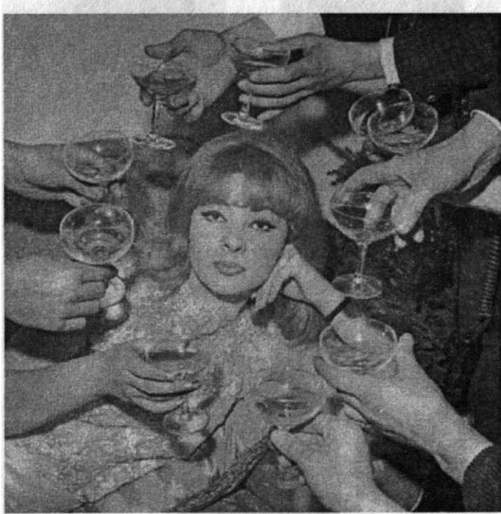
Mandy Rice Davies. Lord Profumo skandalında 'Honey Trap' km. Türkiye'de de çok mehur bir isim hâline gelmiş tir. İmdi 64 yaında, anılarını yazıyor.