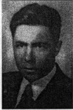
Aleksandr Feklisov. KGB'nin en güvenilir ajanı. Rosenbergları ve Klaus Fuchs'ı yönetti.