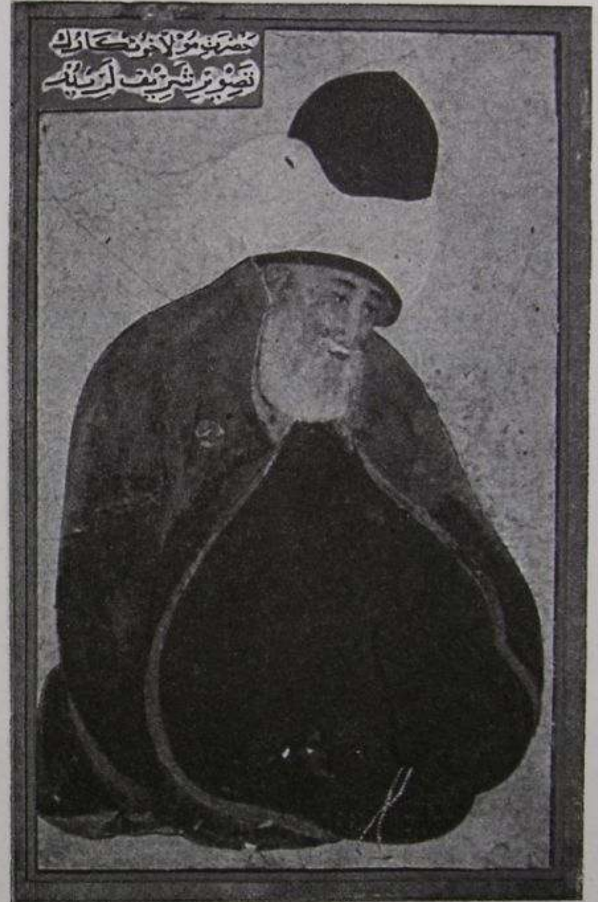
Mevlâna Celâleddin Hazretleri (Minyatür, Belediye Müzesi)