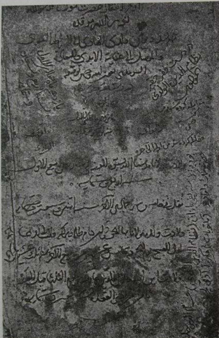
Mevlâna'nın, oğlunun, torununun doğum tarihlerini bildiren Sultan Veled Divânı'nın son sahifesi