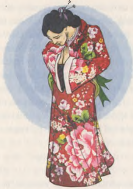
Japon kadınların geleneksel kıyafeti kimono.

selen yapraklarıyla, bir heykel gibiydi kopardığı dal. Elindeki küçük dal gerçektir. Bir düşünemediğinin kanıtı olmalıydı bu da.