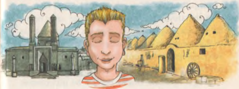
İşte Ege'nin gördüğü anıt ve Harran evleri.

Van'a gitti sonra da. Dünyamızın en ilginç kalelerinden biri olan Van kalesini görüp geri döndü.