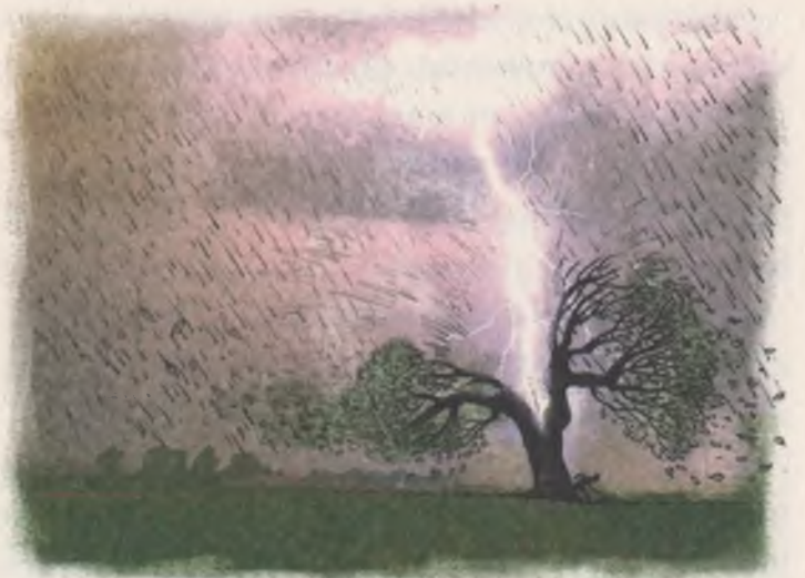
İşte Ege'nin altına sığındığı koca meşe ağacı böyle bir şey.

"Ağaçlık yerlerde, ormanda dolaşırken şimşekli, yıldırımlı bir yağmur başlarsa ağaçların altına sığınmayın, büyük ağaçlar yıldırımını çeker. Açıklık bir yere gidin. İslanmanın kimseye zararı dokunmaz. Şeker