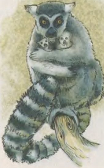
Gördükleri lemur böyle bir hayvandı.