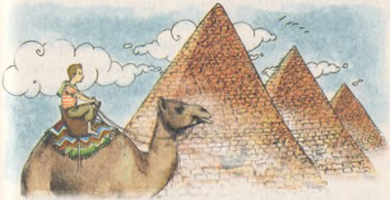
İşte Ege'nin Mısır'da gördüğü piramitler

Yorulmuş ve pek sıkılmıştı. Gözlerini yumdu, pıt, yatağının önündeydi.