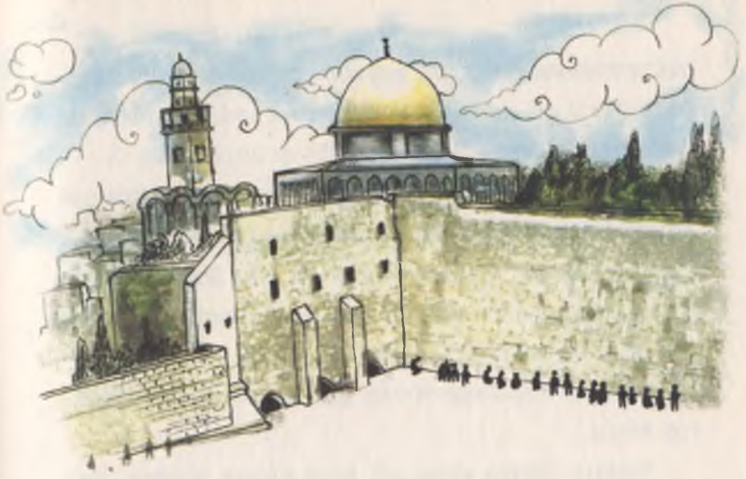
Ađlama Duvarı ve Yeniden Dođuş Kilisesi iřte böyle yerler. Ađlama duvarının arkasında da Kubbetül Sahra görülüyor.

kimisi de dileklerini yazdıkları kâğıtları, taşlar arasındaki boşluklara sıkıştırıyordu.