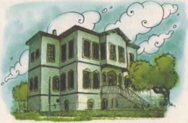
Alanya Atatürk Müzesi işte burası. Çok güzel bir yapı değil mi?

da, Atatürk'ün kişisel eşyaları sergileniyordu. Üst kat ise geleneksel bir Alanya evi olarak döşenmişti. Ege, tüm yorgunluğuna karşın, burayı görmeden gitmediği için pek mutlu olmuştu. Her yanını blok blok apartmanların kapladığı Alanya'da bu ev bir inci gibi duruyordu.