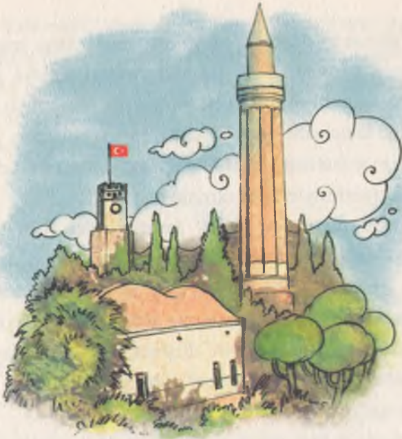
Ege'nin gördüğü görüntü böyle bir şeydi.

Koku... Bir şeyi koklarsın o koku ciğerlerine giderken beynini de uyarır; ya hoş bulursun o kokuyu ya da kötü. Ama o kokuyla birlikte insanın ciğerlerine de bir şey gider. Kokunun maddesi olan şey neyse o işte. Eski evin avlusundayken gözle görünür hiçbir şey yoktu havada ama portakal çiçeklerinin kokusunu duyumsamış, sevinçle içine çekmişti. Havaya yayılan bir şeyler olmasaydı portakal çiçeklerinin kokusunu da alamazdı.