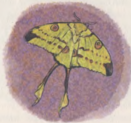
Bu da komet kelebeği. Komet kelebeklerinin her biri insan eli büyüklüğündedir.