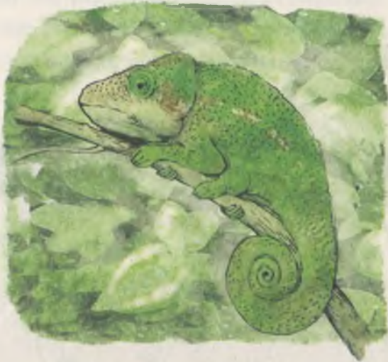
Ege'nin gördüğü Madagaskar'ın bukalemunları işte buna benziyordu.

Yine, "Keşke böyle bir bukalemunum olsa," diye geçirdi içinden. Okulda arkadaşlarına ne hava atardı ama... Buradan bir bukalemunu alıp götürmenin ne büyük bir doğa cinayeti olacağı geldi aklına yine. "Her şey doğal ortamında güzel," diye düşündü.