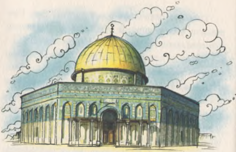
İşte Ege'nin hayran kaldığı altın kubbeli, mavi Kütahya çinili Kubbetül Sahra Camii. Siz hayran olmaz mıydınız?

daracık sokaklarda dolaşırken kemerli, üstü kapalı bir yol çıktı karşısına. Birden kendisini, İstanbul ve Urfa, Mardin, Edirne, Kayseri gibi çeşitli illerimizde bulunanlara benzeyen bir kapalı çarşının orta yerinde buluverdi.