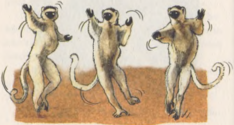
Lemur'un yaptığı danstan görüntüler.