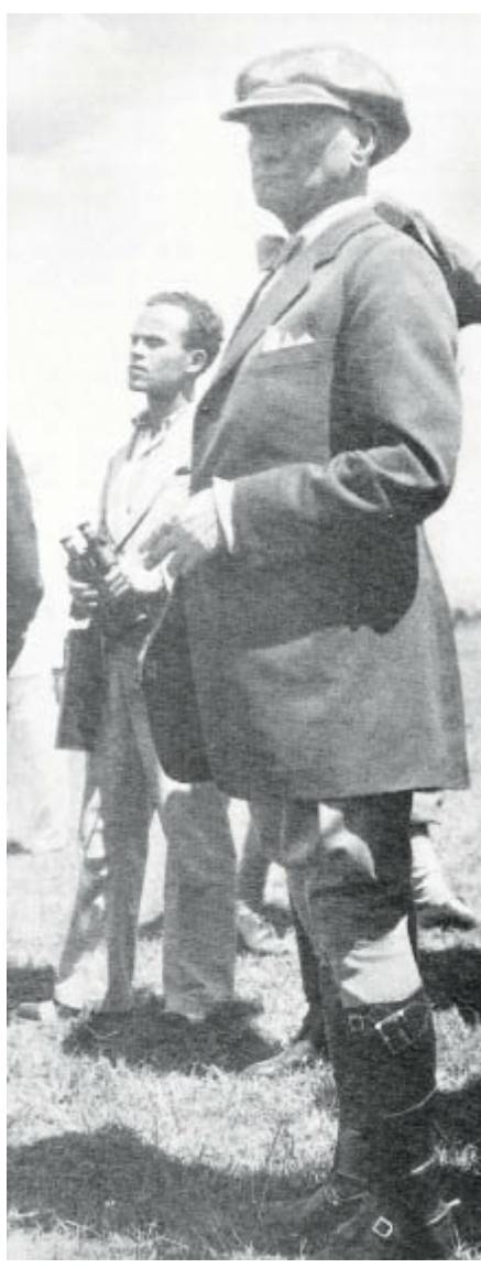
Trakya Manevraları'nda. 17-20 Ağustos 1937.