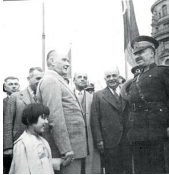
Manevi kızı Ülkü ve Fevzi Çakmak ile birlikte. 27 Mayıs 1938.

Kendisi de emekliliğini istiyor. Atatürk'ü emekli etmeyi düşünebiliyor musun? İnönü, Fevzi Çakmak'ı yirmi altı sene emekli edemiyor. Yirmi altı sene Genelkurmay Başkanlığı yapan bir asker! Atatürk hayatta olsaydı böyle bir şey olmazdı.