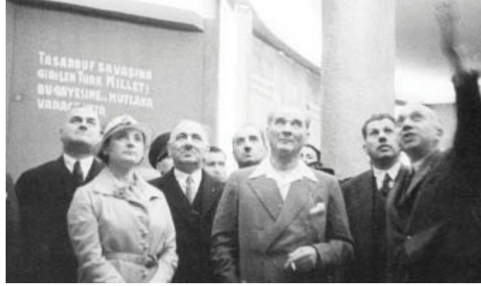
Meclis Başkanı Kazım Özalp, Salih Bozok ve Kılıç Ali ile birlikte Dolmabahçe Sarayı'nda açılan İş Bankası Sergisini gezerken.13 Eylül 1934.