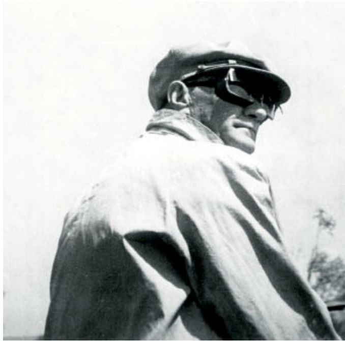
Trakya Manevralarını denetlerken. 21 Ağustos 1937. 05:45'de çekilmiştir.

Mesela 1927 senesinde ordudan ayrılıyor, emekli oluyor mareşal rütbesiyle. Bir daha asla askeri üniforma giymiyor. “O, ordudakilerin hakkıdır” diyor. Ama titri başkomutan, cumhurbaşkanı. Manevralara gidiyor, orası için en uygun kıyafetleri giymiş oluyor. Manevrada ata binecek, çizmelerini giyiyor, süvari pantolonunu giyiyor ama sivil, nefis bir ceket. Papyon takıyor, rüzgarda kravat uçuşmasın diye. Her kıyafeti yerine göre. Akşam giydiği kıyafetler başka, bir resmi geçide giderken giydiği kıyafetler başka, bir kulübe giderken giydiği kıyafetler başka, dostlarıyla oturduğu