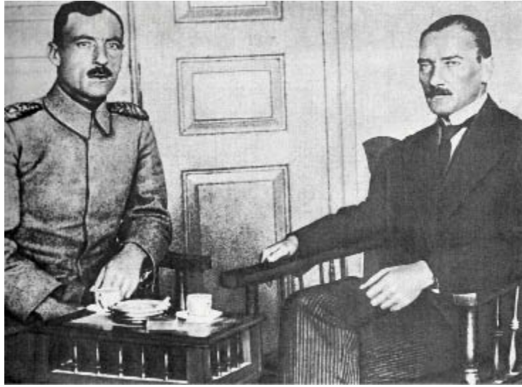
Mustafa Kemal Sivas Kongresi günlerinde Yarbay Cemil Cahit ile birlikte.

Söylediğim gibi, Mustafa Kemal bu işe soyunduğunda rütbesi tuğgeneral. Beraber çalışacağı bazı komutanlar kendisinden rütbeli. Burada bir problem var. Hareketi padişah yönlendirebilir, fakat böyle bir niyet kesinlikle söz konusu değil. İkinci bir yol olarak da hareketi halk yönlendirebilir.