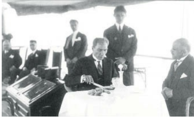
Ertuğrul Yatı'nda öğle yemeği sırasında.

Sonra, iktisattan en iyi anlayan adamların bir araya gelmesini sağlıyor. Bunlar bazen birbirleriyle geçinmiyorlar, çünkü değişik iktisadi doktrinlere inanıyorlar. Bir tarafta Celal Bayar, bir tarafta İsmet İnönü. Celal Bayar Maliye Bakanı, İnönü Başbakan. Aynı kabinede çalışıyorlar, felsefeleri farklı. Atatürk olabildiğince bunları yönlendiriyor ve hepsine şunu öğretiyor, öğütlüyor: Çocuklar, bir hedef var, o da ülke. Ülke için en iyisini yapacağız, elimizden geldiği kadar.