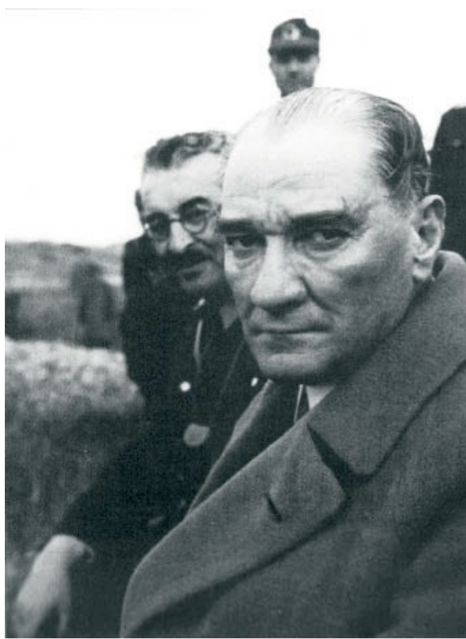
Metris'deki bir tatbikat sırasında. Bu fotoğraf 29 Mayıs 1936 Pazar günü saat 05:45'de çekilmiştir.