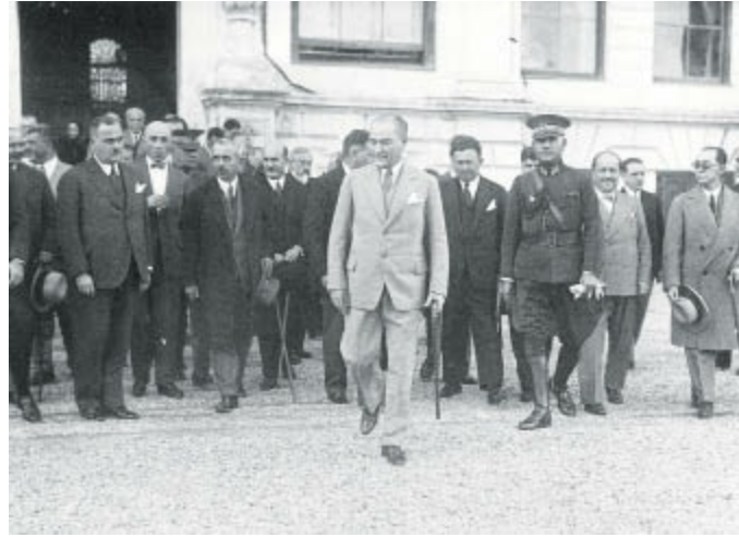
Dolmabahçe Sarayı'ndan ayrılırken. Kazım Özalp, İsmet İnönü, Tevfik Rüştü Aras, Fethi Okyar kendisine eşlik ediyor.

Üniversitelerin var, sanayide bir atılımın içine girdin, halkın ihtiyacını da ufak ufak karşılamaya başladın fakat para lazım. Aynı zamanda parayı da yönetecek yerler lazım. Osmanlı'dan tevarüs edilmiş bir Ziraat Bankası var, ta Mithat Paşa zamanında kurulan. Bir Osmanlı Bankası var, fakat senin değil, Fransızların. Atatürk Hindistan'dan Kurtuluş Savaşı için gönderilen paraların bir bölümüyle İş Bankası'nı kuruyor ve bu paraları mümkün olduğu nispette Türkiye'nin ihtiyacı olan müesseselerin bina edilmesi için kullanıyor. Mümkün olduğu nispette diyorum çünkü fazla para yok.