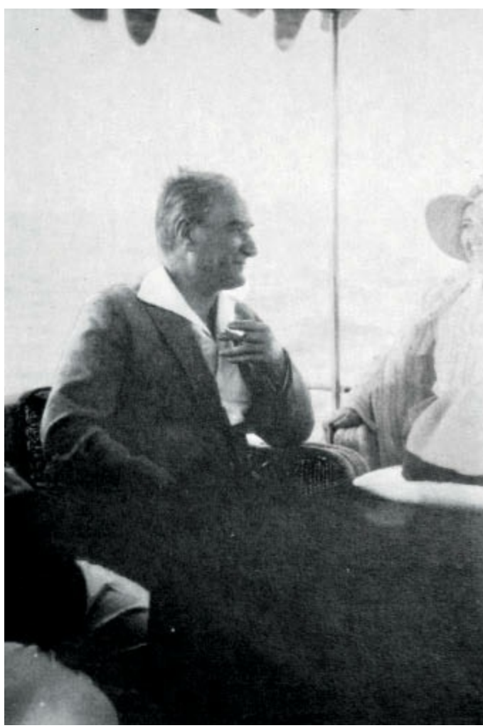
Oya Őengör'ün byk amcası Recep Zht Soyak'ın objektifinden Atatrk