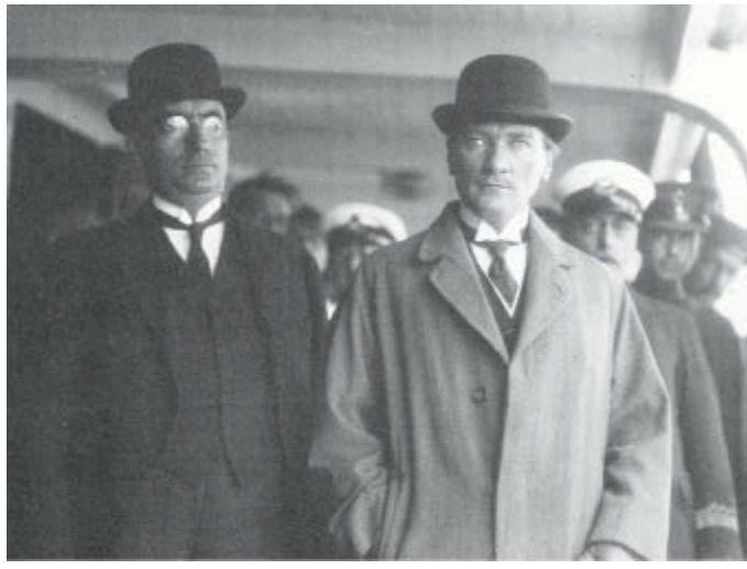
Kadıköy Vapuru'nda Yalova'ya giderken. 4 Aralık 1930.