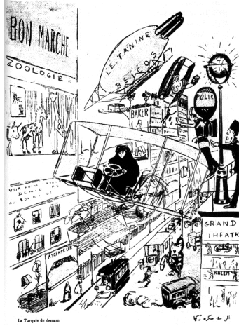
Türkiye'nin Geleceği (Kalem, Kasım 1910)

Bir kadın pilot üzerinde alışveriş merkezi, hayvanat bahçesi, tiyatro olan bir ana caddeye sakin bir şekilde uçağını indiriyor. 291