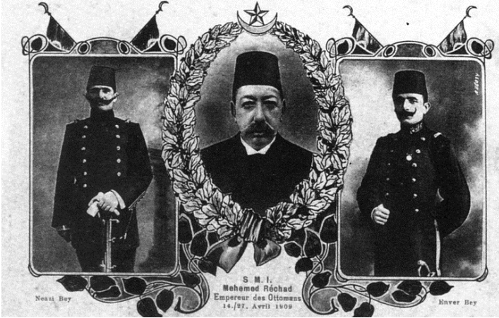
1909: Padişahlar geçici; devrim süreklidir 80

Niyazi ve Enver'in arasında 1908'de Padişah Abdülhamit, 1909'da Padişah V. Mehmet Reşat var