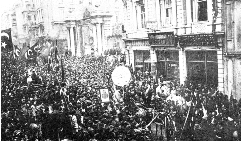
1908, seçim sandıklarını götürenler Ermeni ve Türkçe şarkı söylüyorlar 81