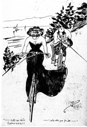
Sağlam kafa sağlam vücutta bulunur: Spor yapalım (Davul, Ocak 1909)

Bir kadın pilot üzerinde alışveriş merkezi, hayvanat bahçesi, tiyatro olan bir ana caddeye sakin bir şekilde uçağını indiriyor. 291