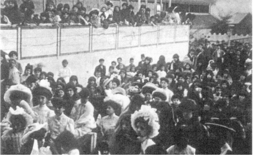
Selanik'teki politik toplantılara başı açık ve kapalı çok sayıda kadın katılıyordu 107 .

Federasyon ise büyüdü, Makedonlar gibi yeni etnik gruplar için çekim gücü oluşturdu. Katılanlar arasında 1908 Osmanlı Meclisi'ne seçilen Dimitar Vlachoff da bulunuyordu. Federasyon içinde küçük Türk ve Rum grupları da oluşturuldu.