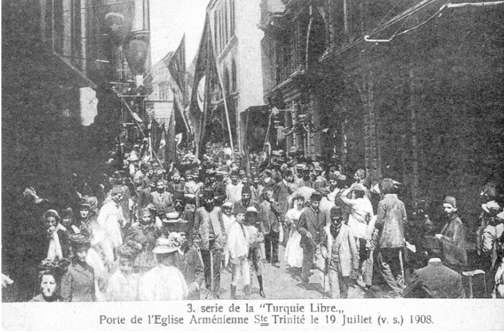
3. serie de la "Turquie Libre., Porte de l'Eglise Arménienne St e Trinité le 19 Juillet (v. s.) 1908.

İstanbul, Temmuz 1908: Balıkpazarı'ndaki Üç Horon Kilisesi'nde yapılan ayin sonrası Müslümanlar ve Ermeniler özgürlük kutlaması için hep beraber Taksim'e yürüyorlar. 73