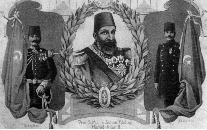
1908: Yaşasın Anayasa! (Padişahın tahttaki ömrü uzun olmayabilir!) 79