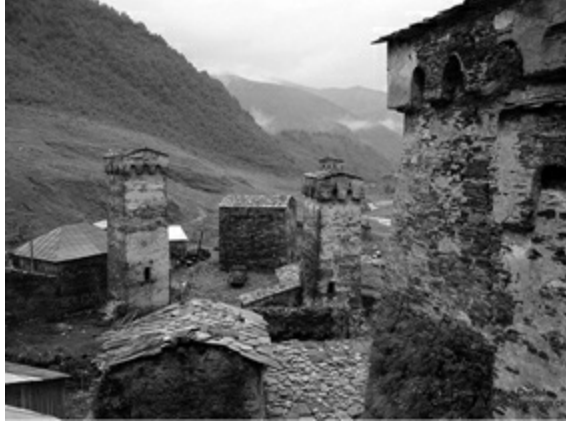
Uşguli köyü, Svaneti.

Gürcistan'da bugün Svanlardan ve Svancadan söz etmenin popüler olmadığı anlaşılıyor. Mestia ile ilgili tanıtım sayfalarına bakıyorsun, Şırnak yahut Muş valiliğinin web sitelerinden farkı yok.