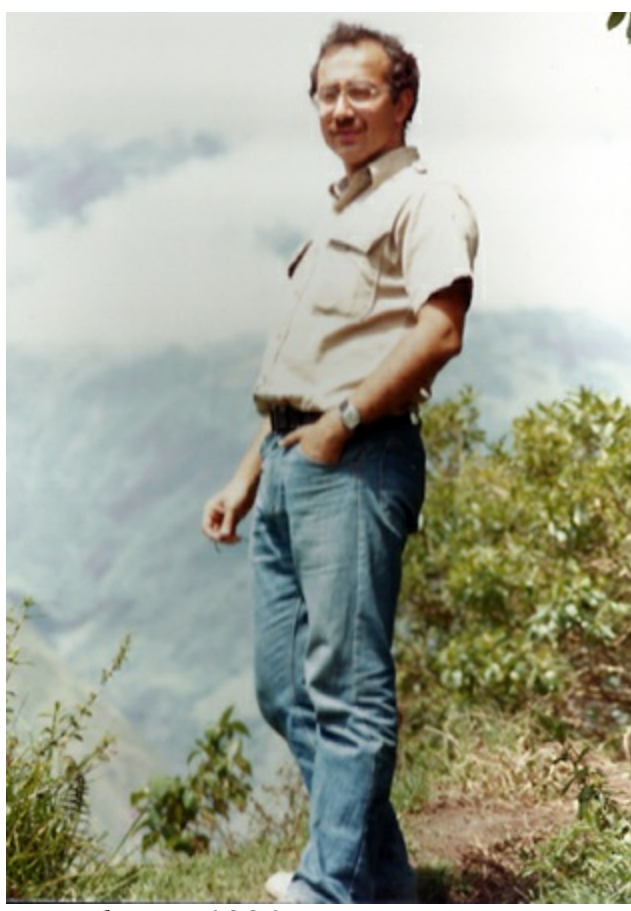
Ecuador'da Tungurahua volkanına karşı, 1981.