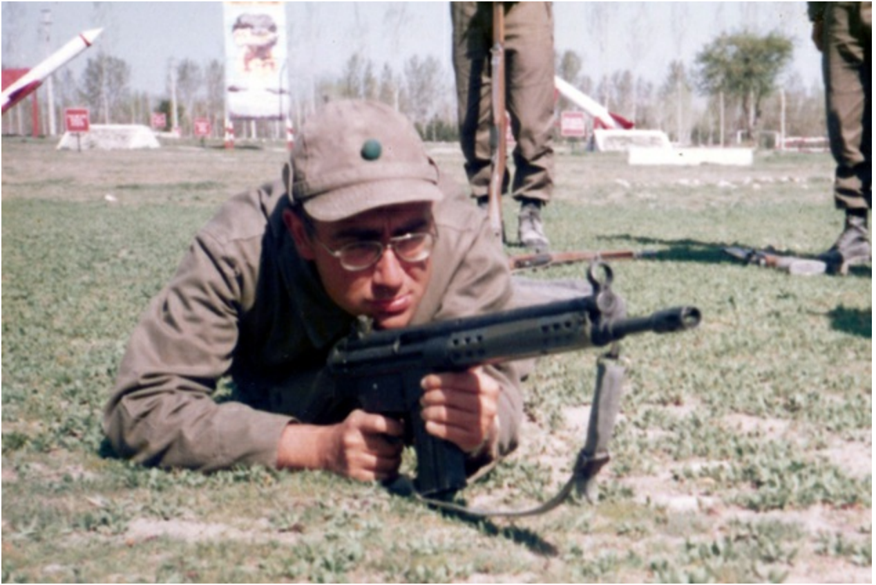
Isparta 40c Piyade Alayı, 1986.