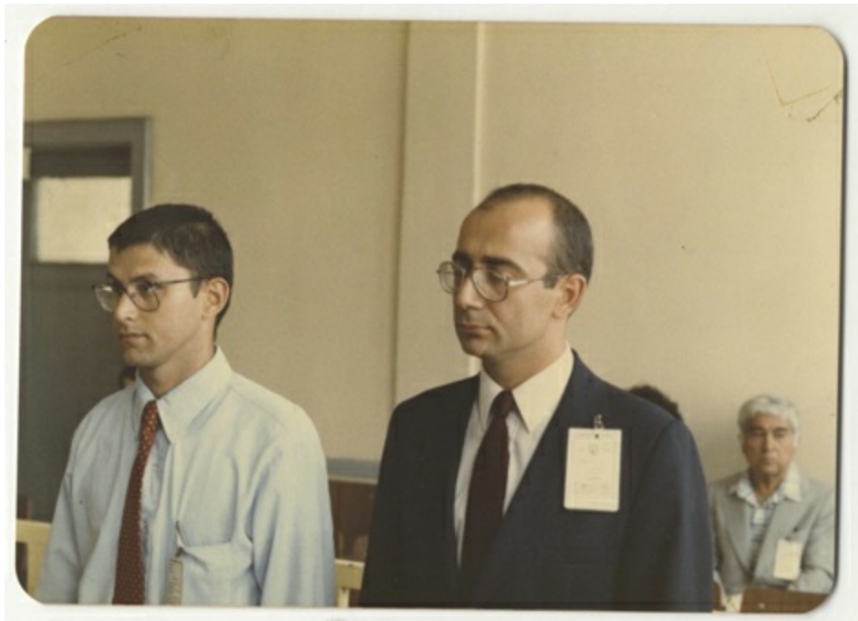
Ali Nesin'le. Arkada Aziz Nesin.