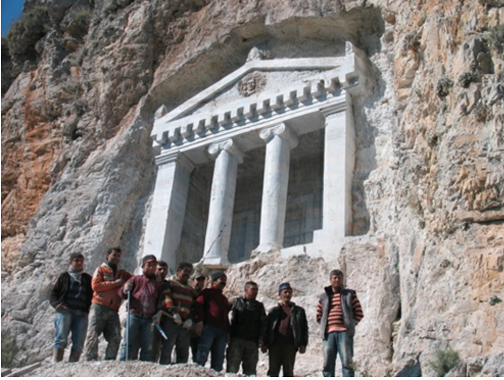
Kayamezarı açılış töreninde usta ekibim, Şubat 2012.

Belki Şirince kaya mezarı kalır. “ O karanlık devirde bile güzeli arayan insanlar varmış, ” diye hatırlarlar.