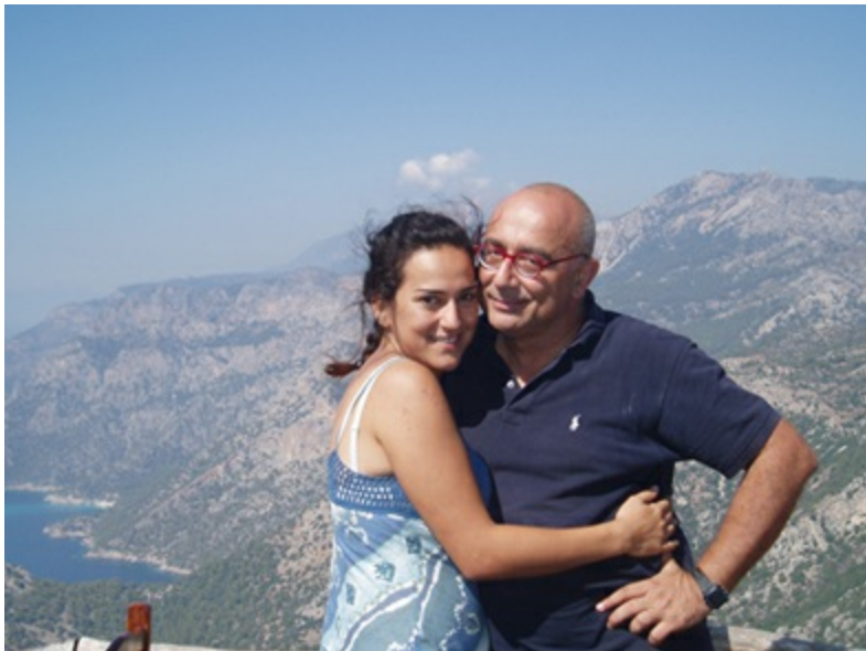
Mutlu günlerinde, Demre yakınları, 2009.

Bu kitabı o çaresizliğin verdiği can sıkıntısı günlerinde yazdım. Eskileri anıp biraz oyalandım. Benimle belki hiç doğru dürüst vakit geçirmeden büyüyecek olan çocuklarım günün birinde bunları okuyup biraz olsun babalarını tanıma fırsatı bulur diye umdum.