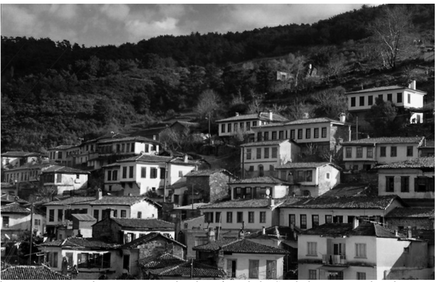
Ortada en üstte Kerevetli Ev, onun sağ altında, çift cepheli, Cumbalı ve Hamamlı Evler.