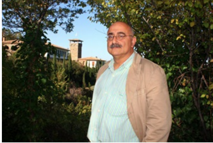
Hodri Meydan Kulesi, 2010.