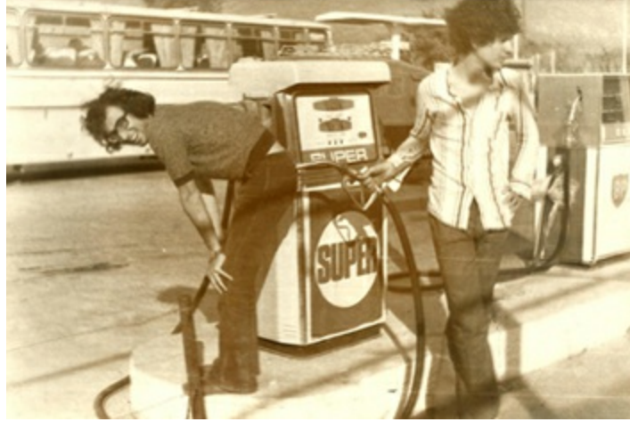
Lisenin bittiği yaz Osman Kavala ile.