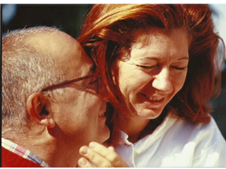
Yorgunluk günleri, 2008.