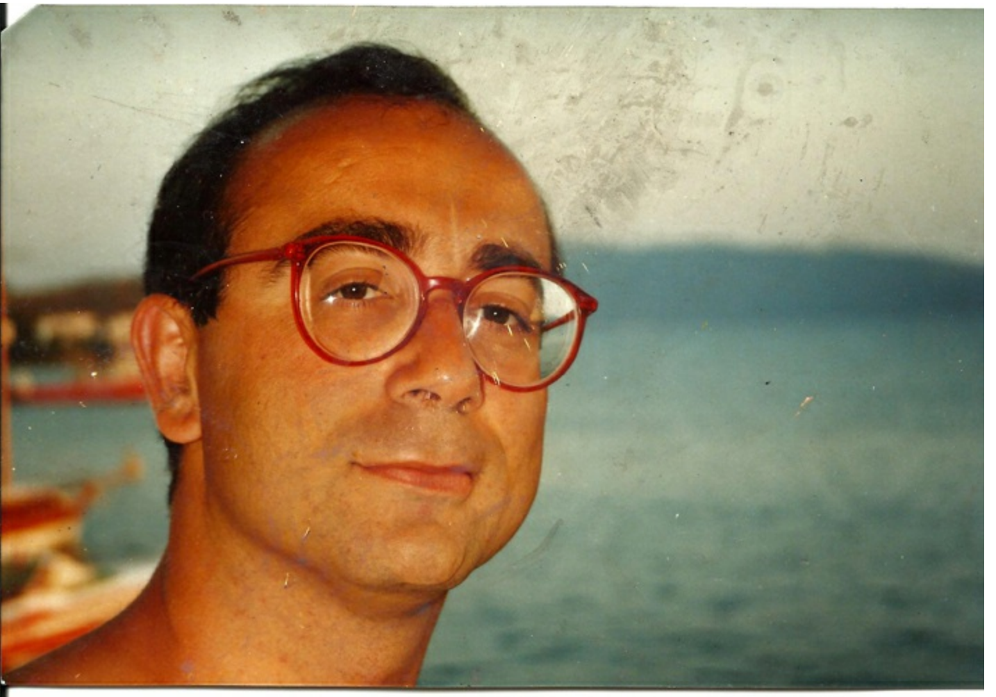
Yunanistan'da bir ada, 1990. 19 yıl takacađım kırmızı çerçevesli gözlük, peri kızının yadigârıdır.