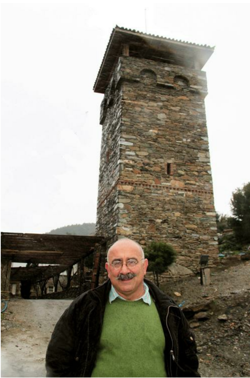
Kulelerin efendisi, 2011.