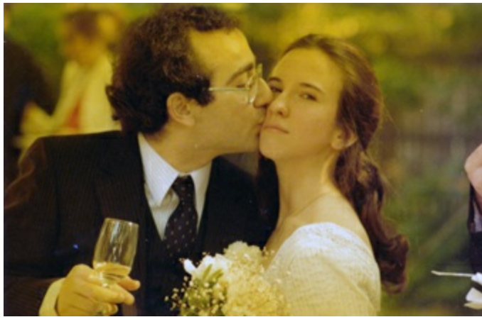
Mutlu günlerinde, 1981.