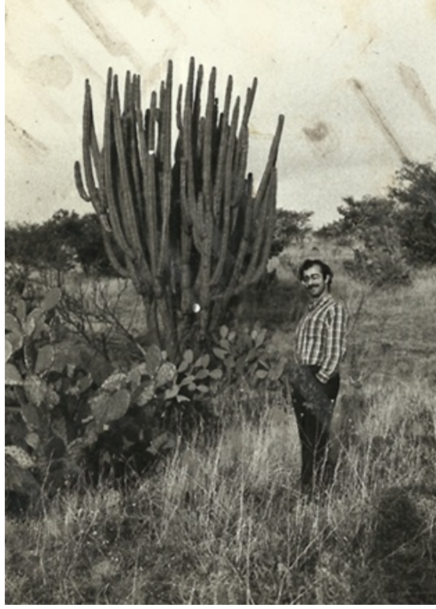
Aguascalientes ile Guadalajara arası, Meksika, 1979.

Sabah gün ıştırken bülbül gibi İspanyolca konuşuyordum. Körkütük sarhoş Meksikalı pazarcılarla siyaset üstüne ahkâm kesecek kadar, en azından.