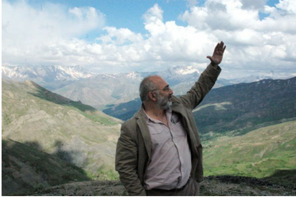
Hizan ile Bahçesaray arasında UFO trafiğini yönetirken, 2010.