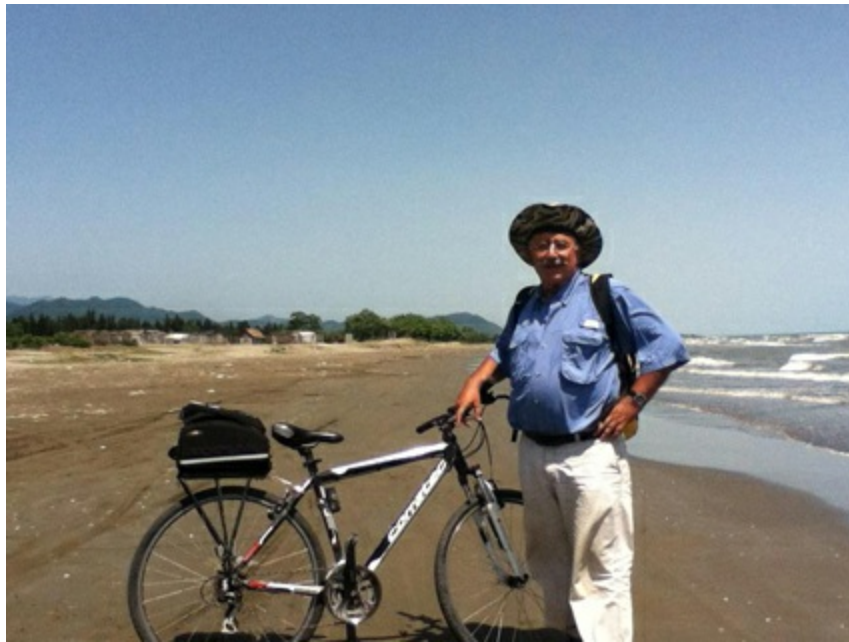
Hazar Denizi kıyısı, Talış, İran, 2012.

Kötü bir niyetim yoktu, uluslararası komplo filan da yoktu. Türkiye o devirde bana pasaport vermiyor, Isparta piyade tümeninde Ali Nesin’le başımıza gelenler yüzünden, ben de mecburen kendi uçağımı kendin yap kampanyası açmışım. Bakü’de çok da güzel gezmiş, konukseverlik görmüşüm. Ama şimdi kolaysa bu hıyarlara anlat bakalım.