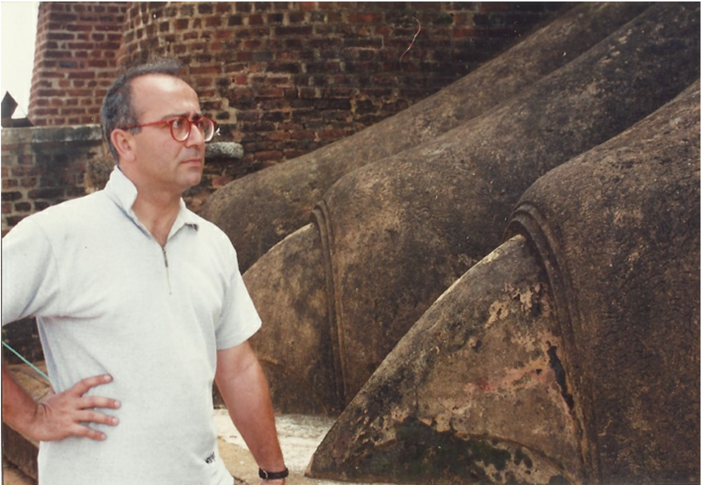
Sigiriya aslanının yüz ifadesini etüt ederken. Sri Lanka, 1996.

Ertesi sene çıktı. Birkaç defa yazıştık. Memleketine alışamıyordu. Şirince'ye çağırdık, Sri Lanka ile Avusturya'nın ortası sayılır, bir süre kalır intibak edersin. Niyetlendi bir süre, ama olmadı.