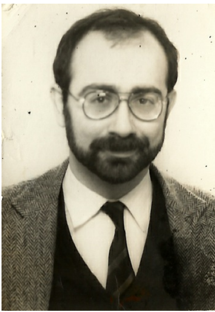
Commodore günleri, 1984.