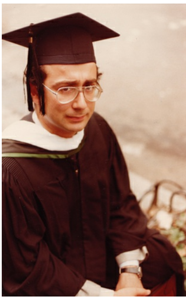
Columbia'da MA töreni, 1983.