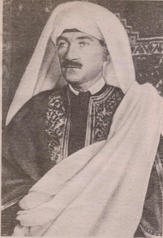
Mustafa Kemal, 1911'de Derne'de.