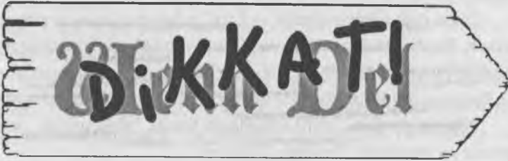
Tabela yerde duruyordu, yapraklar ve küçük bitkilerle kaplanmıştı. Lief yaprakları tabelanın üzerinden aldı, altında yazanı gördüğünde topuklarının üstüne çöküp güçlkle soludu.

“Birisi diğer yolcuları bu yolun tehlikeleri hakkında uyarıya çalışmış. Hiç şüphesiz bu işaret, yolu gizlemek için değil, uyarıyı saklamak için kenara atılmış.” diye mırıldandı Barda.