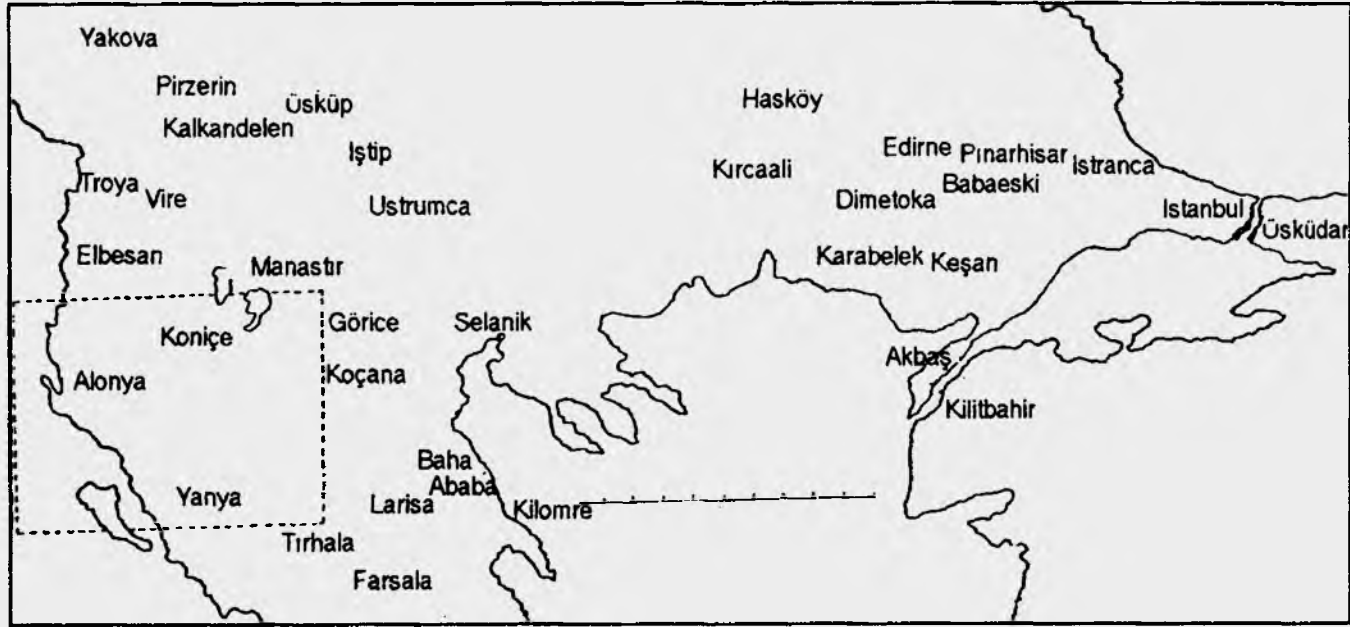
Şekil 2- Bektaşîlerin Avrupa'daki Dağılımlarını Gösterir Taslak Harita