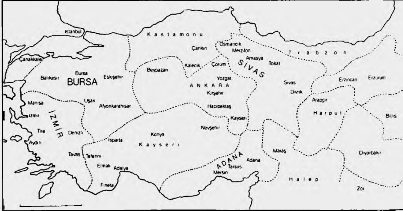
Şekil -I Bektaşîlerin Anadolu'daki Dağılımını gösterir Harita Krokisi