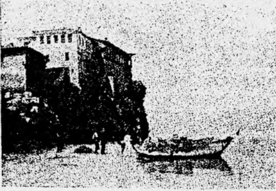
I-II Kalkandelen Tekkesi ve Tekkenin Câmii- III Ohri Gölünde bir Manastır