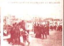
LE PORT DE LA BOUTIQUE ET LES BOUTIQUES