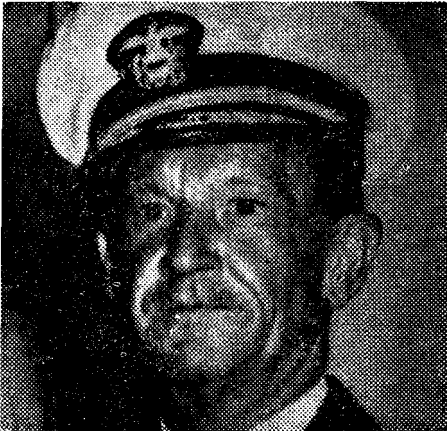
Amiral Frank Fletcher Yorktown'un Komutanı

Aleutianslarda, askeri anlamda adeta hiç bir şey yoktu. Yorktown ve koruma gemileri 2 Haziran günü öğleden kısa bir süre önce Enterprise ve Hornet ile temas sağladı ve Yorktownda bulunan Fletcher komutasında Midway'in Kuzey-Doğusundaki bir noktaya doğru rota tuttular... Uçak gemileri Midwaye doğru seyrederken, Amirâl Nimitz bunların yalnız Yamamoto ile Midway'in arasına girmediğini, aynı zamanda Hawainin de elden gitmesine engel olmaları