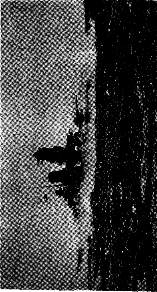
Amiral Yamamoto'nun sancak gemisi Yamato Zirhlisi