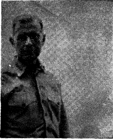
Amiral Reymond Spruance

Jack Donanmadaki lâkabıdır) Yorktown'a tekrar bayrağını çekerek iki kruvazör ve beş destroyerle beraber Pearl Harbordan ayrıldı. Bu Task Force 17 idi ve Task Force 16 gibi o da Midway'e doğru rota tuttu. Evvelce de belirttiğimiz gibi Japonlar ikinci hatalarını burada yapmışlardır. Çünkü, denizaltılar evvelce plânda kararlaştırılan gün ve saatten 24 saat sonra yerlerini almışlardır. Bu gecikme süresinde Amerikan Donanmasının Midway yönünde seyrettiğini görememişler ve tabiatıyla durumu Yamamotoya bildirememişlerdir. Zaten, Amerikalıların elinde bir veya azami iki uçak gemisi olduğu inancı değişmemiş, dolayısıyla Yamamoto ve Nagumo plânlarında bir değişiklik yapmamışlar ve