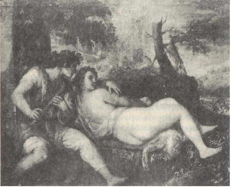
Tiziano, Su Perisi ile Çoban (Viyana, Kunsthistorisches Museum)

fazla tutku yüklü" oldu u muhakkaktır; bununla birlikte, "bu tutku, yapılmı plan varsayımların herhangi birine katılmak için fazla dizginlenmi "tir (Panofsky, 172). Su perisi ile çobanın erotik anlamda birbirlerine ba lı oldukları gayet açık gibidir; ama hem karma ık hem de geçmi e uzanan ili kileri öylesine nev'i ahsına münhasırdır ki, ku kusuz, "fiziksel olarak birbirine öyle yakın, duygularda ise birbirine öyle uzak bezgin sevgililer" olmalıdır söz konusu olan (age). Ve tablodaki her ey-resimdeki rengin neredeyse tekrenkli tonlarda olması, kadının duru una da yansıyan esrarlı ve dü ünceli hali- "bu çiftin Bilgi A acı'ndan yedi ini ve kendi Eden'ini yitirmekte oldu unu fı-sıldar gibi"dir (Dundas, 54).