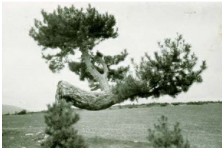
Karadağ’da Üstad’ın yanında ve üzerinde ibadet ve tefekkür ettiği çam ağacı