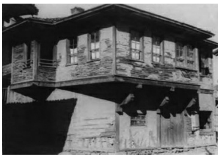
Üstad Bediüzzaman'ın Çarşı Polis Karakolu'nun karşısındaki evi

Kastamonu'da kışlar çok sert geçer. Üstad bir mektubunda şiddetli soğğun verdiği ıstıraptan bahsederek, iman ve sabırla dayanmaya çalıştığını dile getirir: