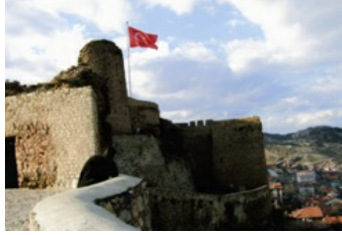
Kastamonu Kalesi ve Münacat Risalesi'nin ilk satırları

Ve hiçbir yıldız yoktur ki, mevzun hilkaıyla, muntazam vaziyetiyle ve nuranî tebessümüyle ve bütün yıldızlara mümaselet ve müşabehet sikkesiyle Sen'in haşmet-i uluhiyetine ve vahdaniyetine işaret ve şehadette bulunmasın. Ve on iki seyyareden hiçbir seyyare yıldız yoktur ki, hikmetli hareketiyle ve itaatli musahhariyetiyle ve intizamlı vazifesiyle ve ehemmiyetli peykleriyle Sen'in vücûb-u vücuduna şehadet ve saltanat-ı uluhiyetine işaret etmesin!”