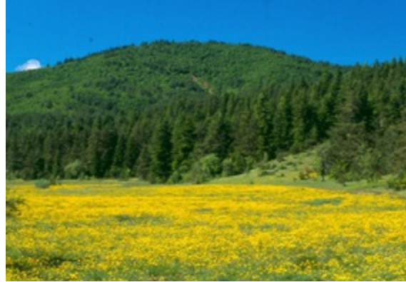
Ayetü'l-Kübra'nın yazıldığı Kastamonu dağlarından bir görüntü

Üstad bunu talebelerine bir mektupta anlatırken, bu hadisenin nazar ve temiz olmayan ruhlar tarafından gelen bir musibet olduğunu, fakat bunun dokuz cihetle nimete dönüştüğünü ifade eder. “Bir şeyde zahmet, meşakkat, alamet-i makbuliyettir” deyip Cenab-ı Hakk’a şükreder.