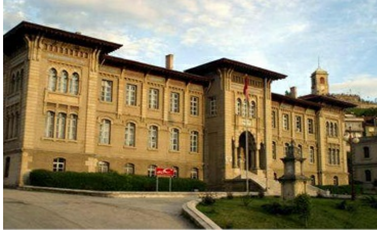
Kastamonu vilayet binası

“Hepiniz okumuş adamlarsınız. Ben karşınızda tek bir kişiyim. Bu tehevürünüz nedendir?” Elinin dış yüzünü onlara, iç yüzünü göğsüne gelecek şekilde tutar ve “Beyler, dünyanın iki yüzü vardır” der. Elinin kendine bakan yüzünü işaret ederek, “Bir yüzü ak,” onlardan tarafa bakan yüzünü göstererek, “bir yüzü de karadır” der.