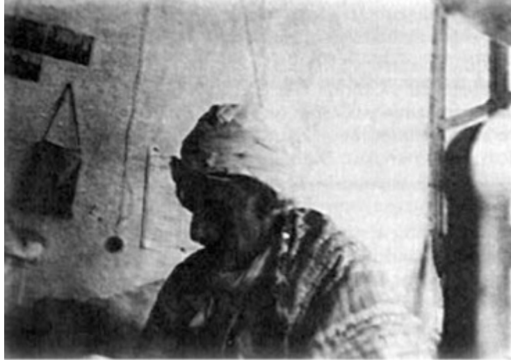
Üstad Bediüzzaman mütevazı odasında

Bu mübarek cübbe halen Urfa'da Abdülkadir Badıllı'nın yanında bulunmaktadır.