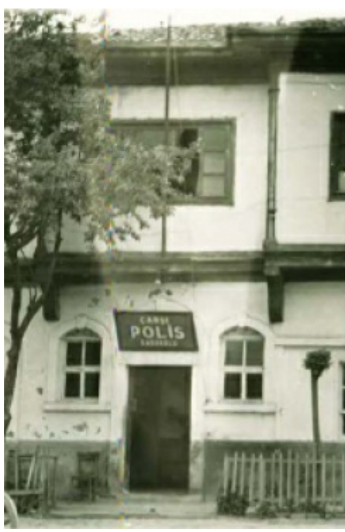
Üstad Bediüzzaman'ın Kastamonu'ya sürgününden sonra üç ay kaldığı Çarşı Polis Karakolu