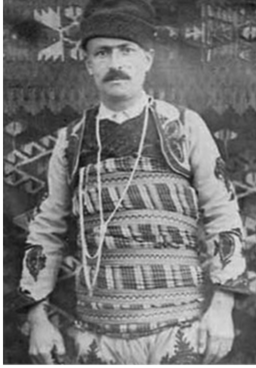
Taşköprülü Sadık Bey

Görüldüğü gibi o günlerde Üstad'la görüşenlerin hepsinde, kelleyi koltuğa alacak bir kahramanlık vasfı bulunmaktadır.