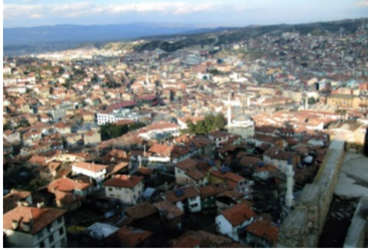
Kastamonu Kalesi'nden şehrin görünüşü

Bir gün Şaban-ı Velî dergâhının yanı başında bulunan Asa Suyu'na nazar ederek, bunun Mekke'deki zezem suyunun bir şubesi olduğunu söyler. Gerçekten o suyu içenler zezem tadını aldıklarını itiraf ederler.