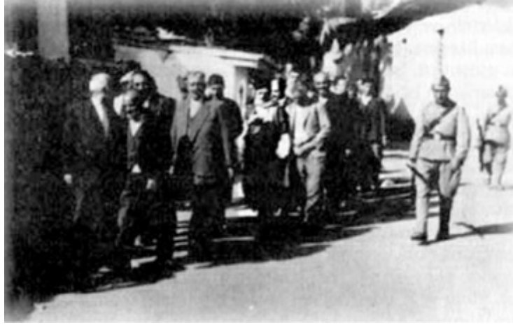
Afyon Mahkemesi’ne götürülen Nur yolcuları...