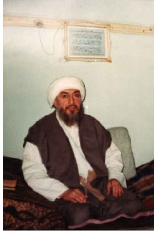
Mehmed Feyzi Efendi

Yüce Rabb’imizden bizi bu büyük Allah dostunun şefaatinde hissedar yapmasını ve bu vatana, bu millete ve özellikle din-i mübin-i İslam’a hizmette bize güç ve kuvvet vermesini niyaz ederim.