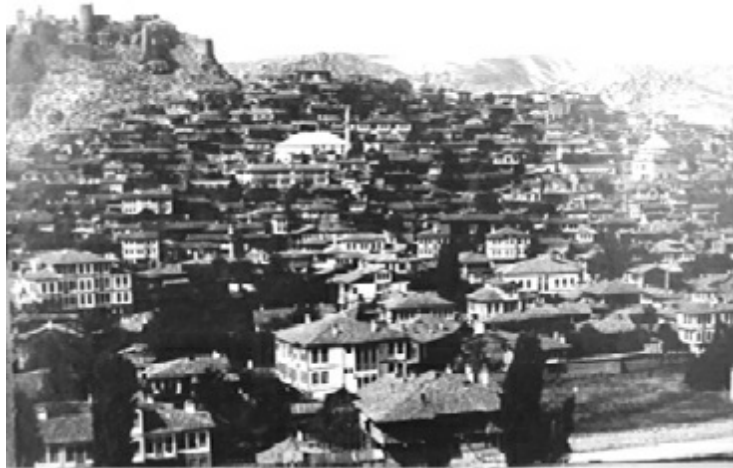
Kastamonu'nun eski bir görünüşü