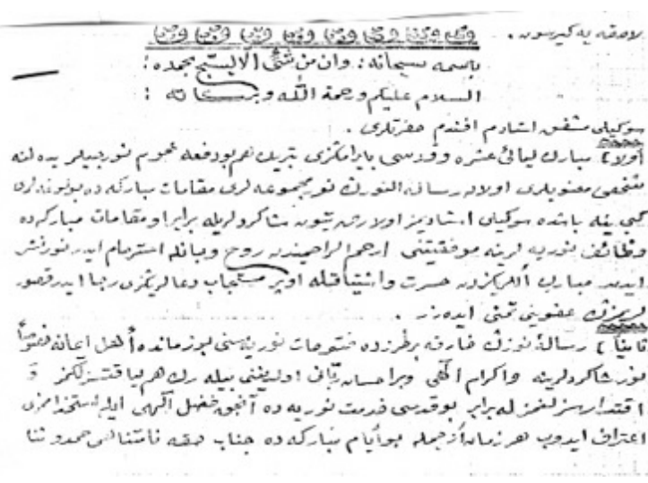
Mehmed Feyzi Efendi'nin Üstad'a yazdığı bir mektup