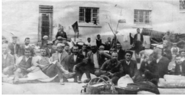
Denizli Hapsi'nden tahliye edilen Nur Talebeleri.