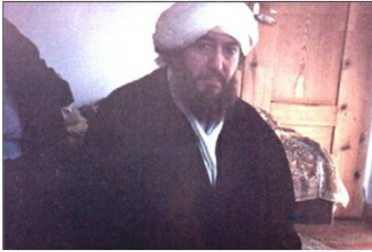
Mehmed Feyzi Efendi

"Hayatımda en zevk aldığım namaz o namazdı" demişti. Denizli'de Üstad'la beraber kelepçelenir, mahkemeye o şekilde giderlermiş.