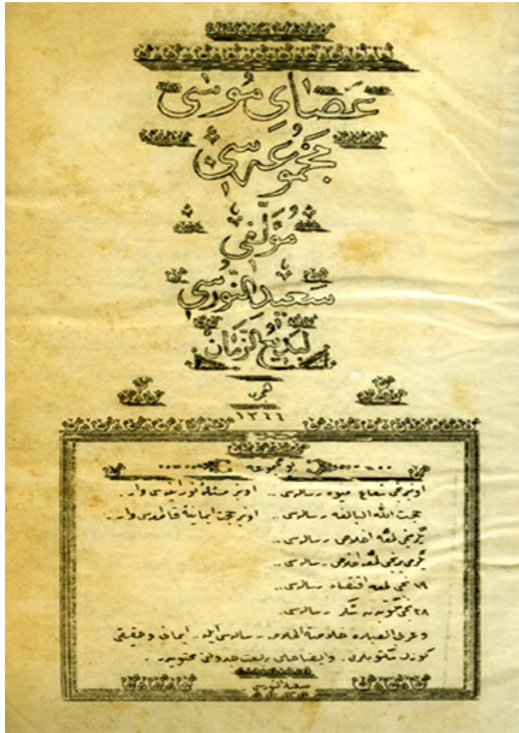
Arkasında Mehmed Feyzi Efendi'nin hazırladığı lügatçenin yer aldığı Asâ-yı Mûsâ kitabının ilk sayfası