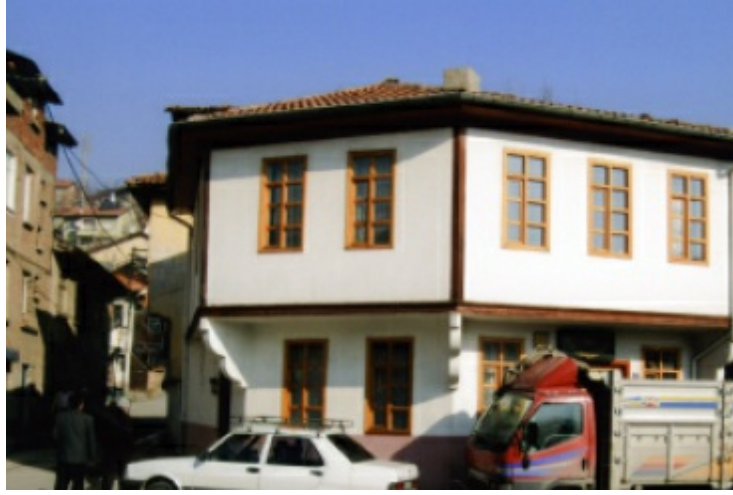
Üstad'ın Kastamonu'daki evinin tamirattan sonraki hali