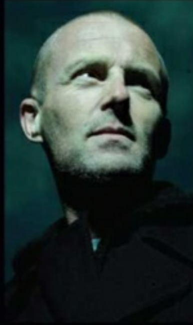
Jo Nesbo

Oslo'da bir banka soygunu sırasında banka görevlisi öldürülünce, Dedektif Harry Hole soruşturmaya dahil olur. Harry, hiçbir iz bırakmayan soyguncunun peşindeyken, eski kız arkadaşı Anna'nın yemek davetini kabul eder. Akşam yemeğinin ertesinde kendi evinde uyandığında, son 12 saatte neler olduğunu anımsayamadığını fark eder. Anna ertesi gün ölü bulunur, çok geçmeden o gecedan haberdar olan biri Harry'yi tehdit etmeye başlar. Harry Hole hem kendini temize çıkarmak, hem de devam eden banka soygunlarını durdurmak zorundadır.