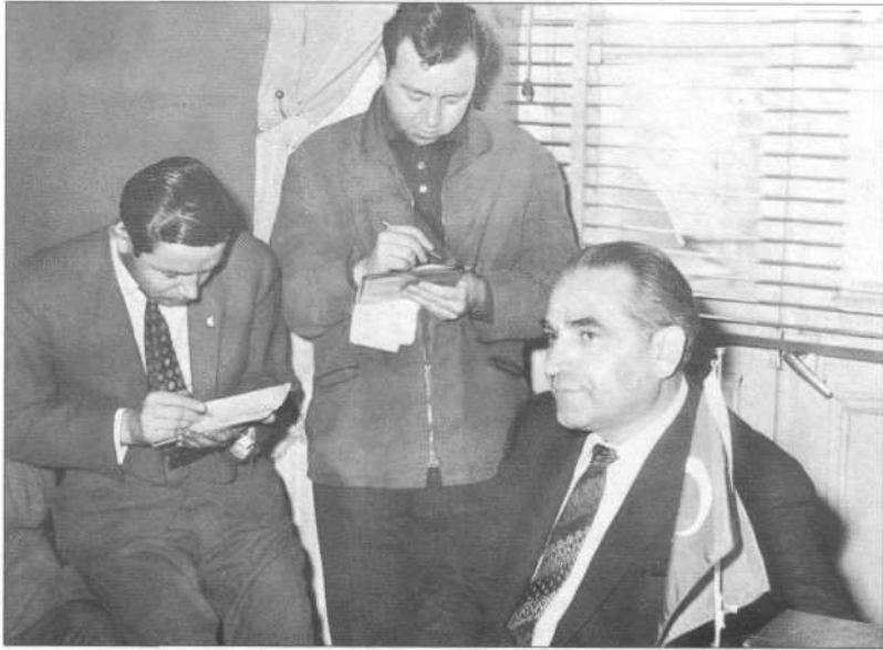
Yüksek Adalet Divanı Başsavcısı Ömer Altay Egesel basın mensuplarına açıklamada bulunurken.