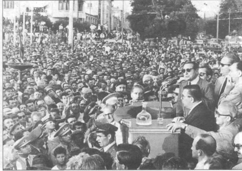
Başbakan Adnan Menderes İzmir'de halka hitap ederken.