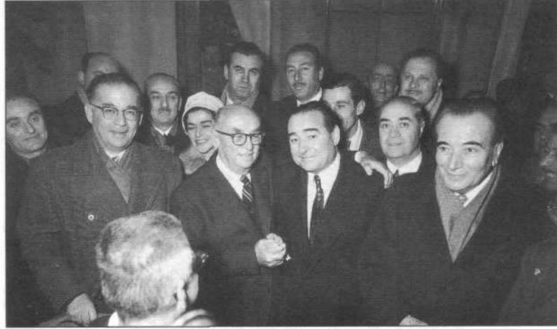
Cumhurbaşkanı Celal Bayar, Londra'da geçirdiği uçak kazasından kurtulan Başbakan Adnan Menderes'i karşılar.