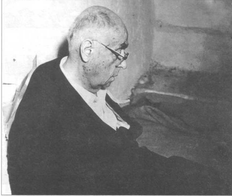
Celal Bayar Yassıada'daki hücresinde.