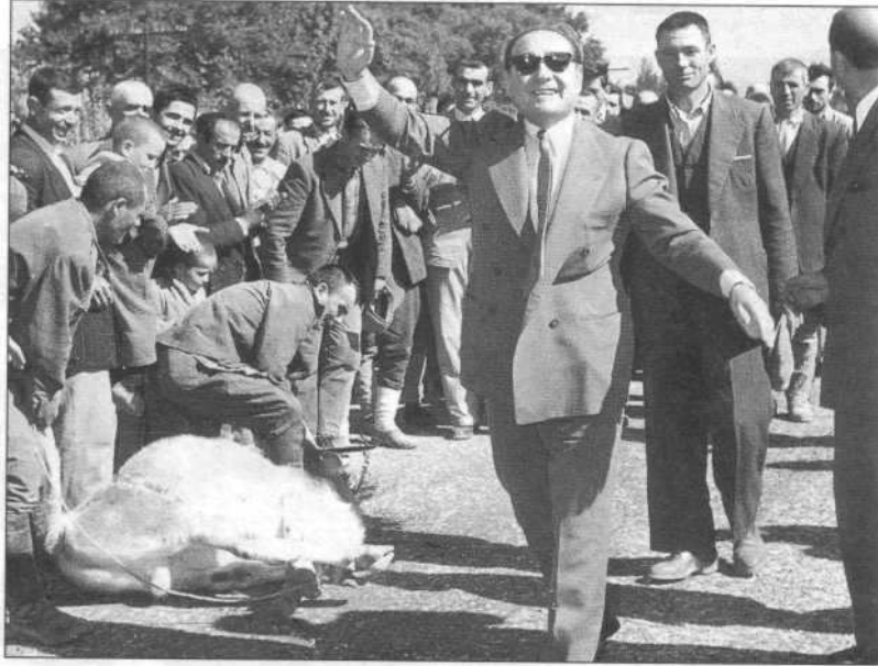
Adnan Menderes, Akhisar'ın bir köyünde. Resmin sol tarafında Başbakan için kurban edilen bir dana görülüyor.