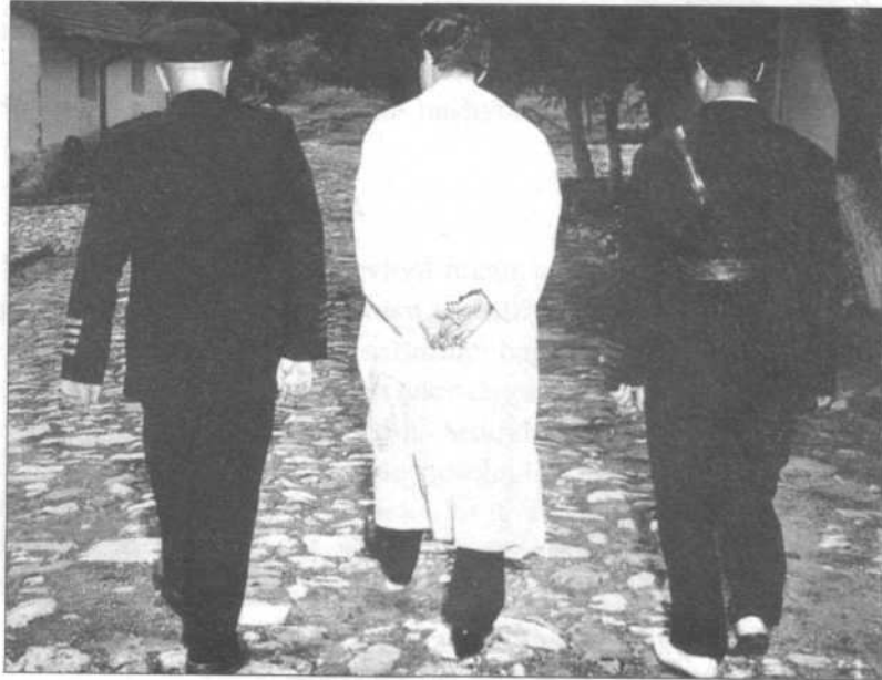
Adnan Menderes idama giderken.