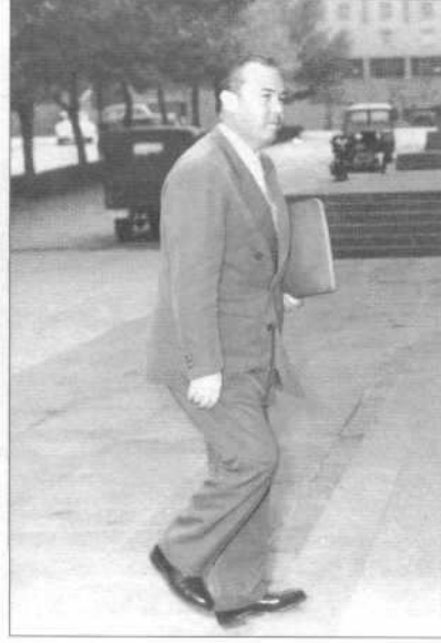
Maliye Bakanı Hasan Polatkan.