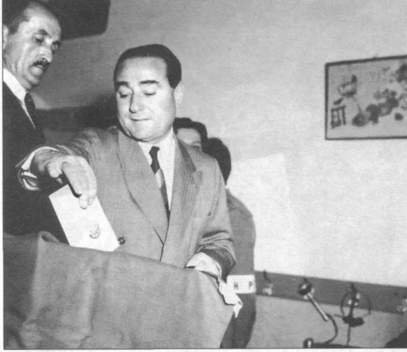
Adnan Menderes sandıkta oyunu kullanırken.