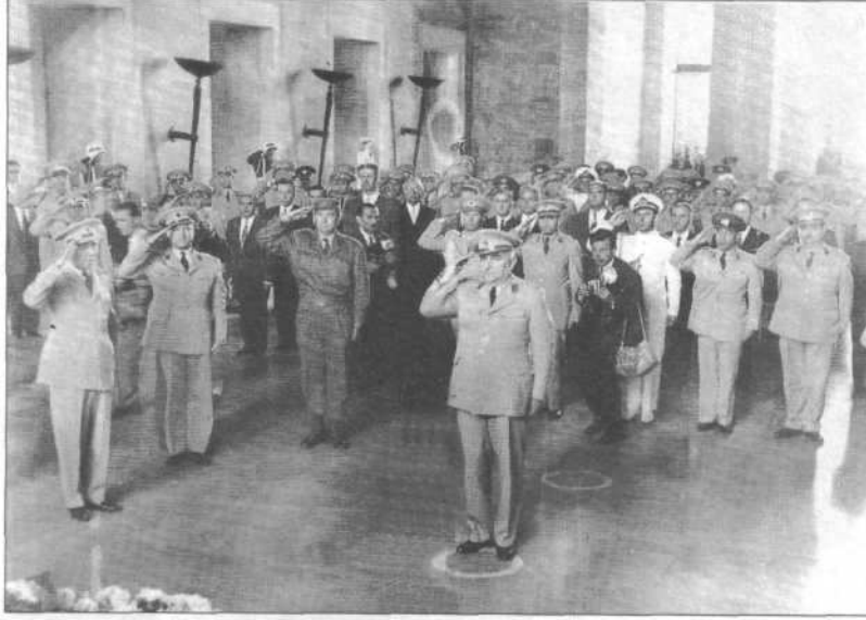
4 haziran 1960. Orgeneral Cemal Gürsel, hükümet mensupları ve yüksek rütbeli subaylar ile birlikte Atatürk'ün manevî huzurunda.