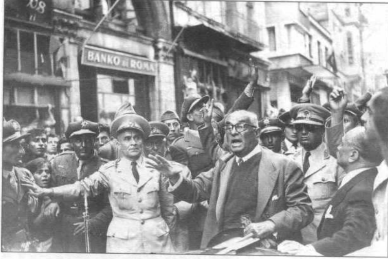
8 Eylül 1955, Celal Bayar İstiklal Caddesi'nde yetkililerden bilgi alıyor.