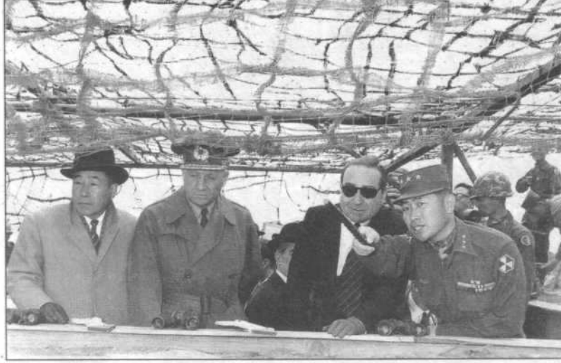
Başbakan Adnan Menderes, Kore'de askerî yetkililerden bilgi alırken.