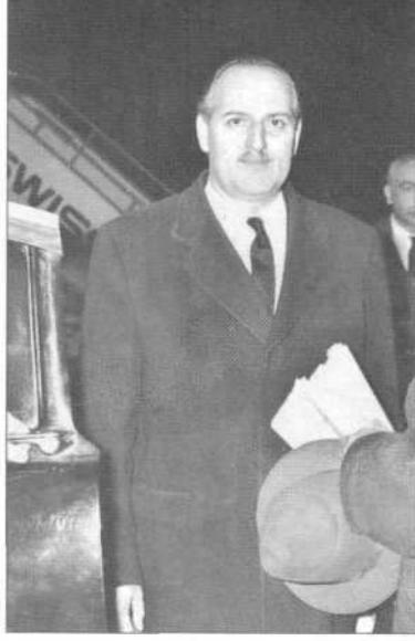
Dışişleri Bakanı Fatih Rüstü Zorlu.