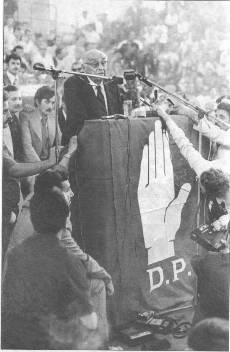
Celal Bayar, Demokrat Parti'nin Spor Sergi Sarayı'nda düzenlenen bir gecesinde konuşurken.