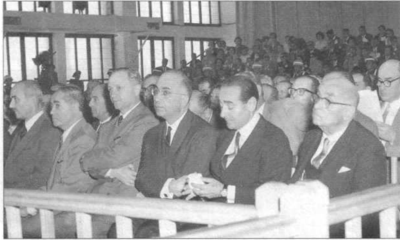
Celal Bayar, Adnan Menderes ve diğer sanıklar duruşmada.