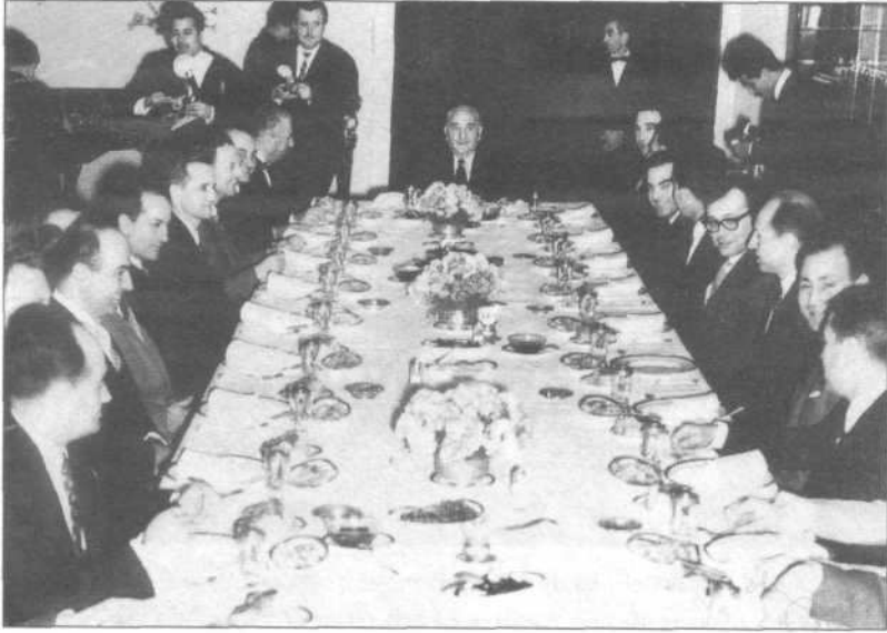
Devlet Başkanı Orgeneral Cemal Gürsel, Millî Birlik Komitesi üeleriyle birlikte yemekte.