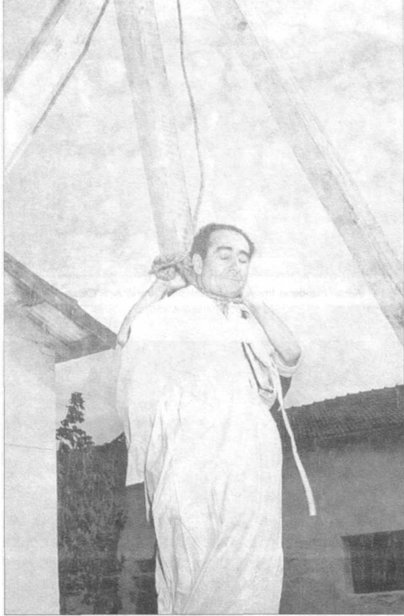
Adnan Menderes, 17 eylül 1961 pazar günü öğle saatlerinde İmralı Adası'nda idam edildi.