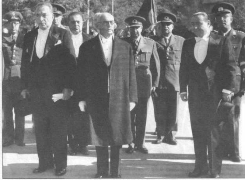
Refik Koraltan, Celal Bayar ve Adnan Menderes. DP'nin, 1954 seçimlerinde kazandığı zaferin hemen ardından bir törende.