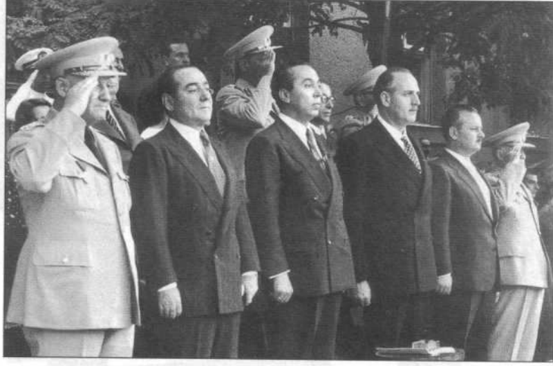
Adnan Menderes, Namık Gedik ve Fatin Rüştü Zorlu Harp Okulu'nda bir diploma töreninde.