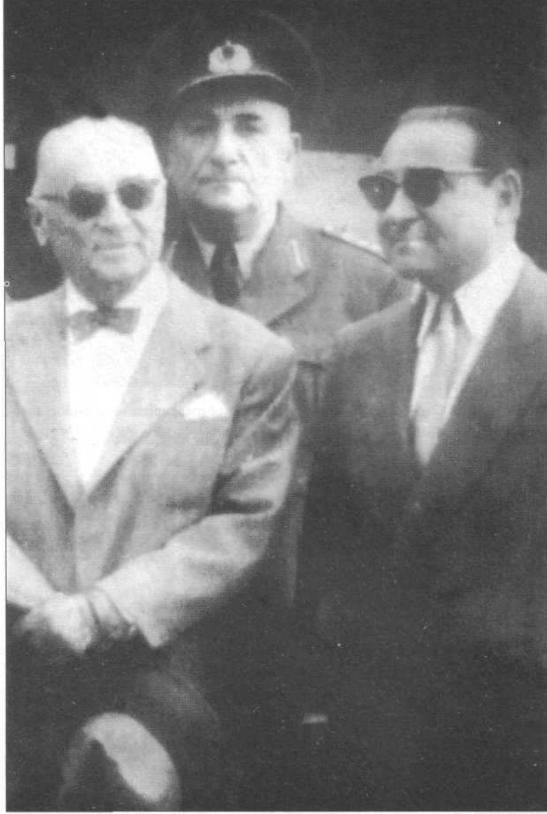
Cumhurbaşkanı Celal Bayar ve Başbakan Adnan Menderes, 1960 yılında gerçekleştirilen ve 10 yıllık iktidarlarına son veren 27 Mayıs ihtilalinin lideri olacak olan Orgeneral Cemal Gürsel'le.