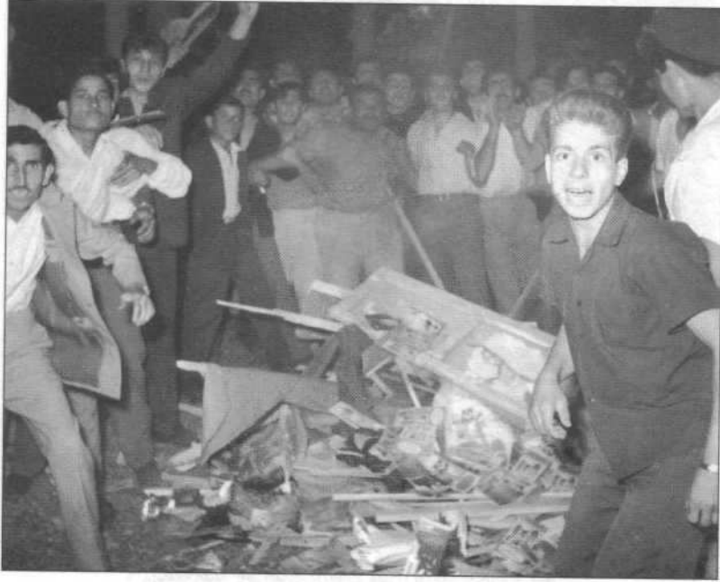
6-7 Eylül Olayları'nda, İzmir Fuarı'ndaki Yunan pavyonunun yağmalanmış hali.