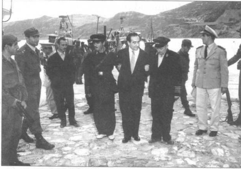
Adnan Menderes İmralı Adası iskelesinde, İmralı Açık Cezaevi'nin gardiyanlarına teslim ediliyor.