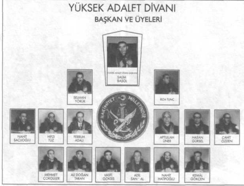
Yassıada Duruşmaları'nı yöneten Yüksek Adalet Divanı.