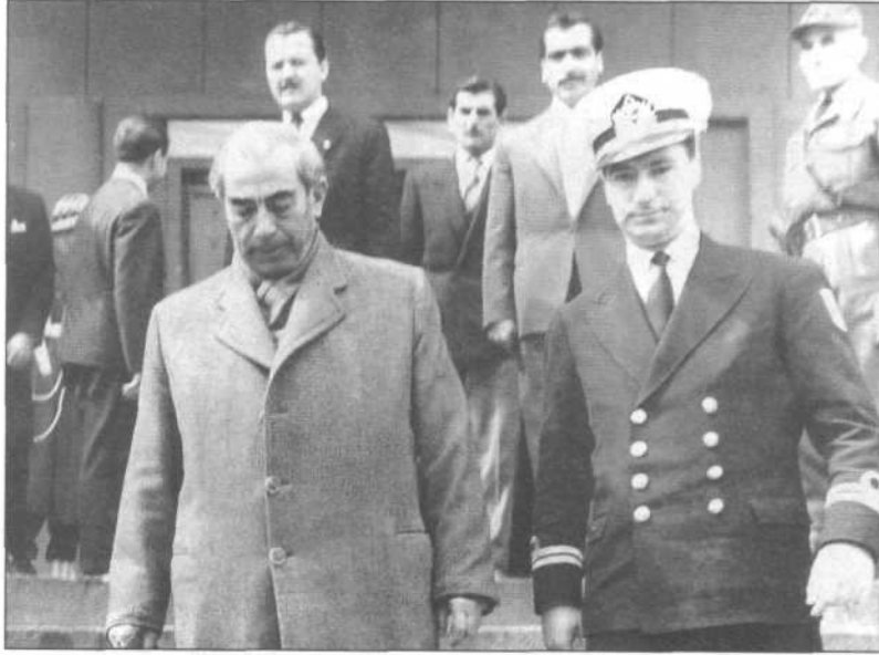
Yüksek Adalet Divanı Başkanı Salim Başol Başbakanlık'tan çıkarken.