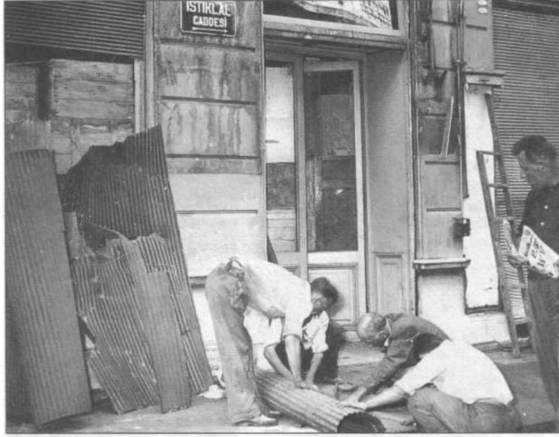
6-7 Eylül Olayları'nda yağmalanan bir dükkân.