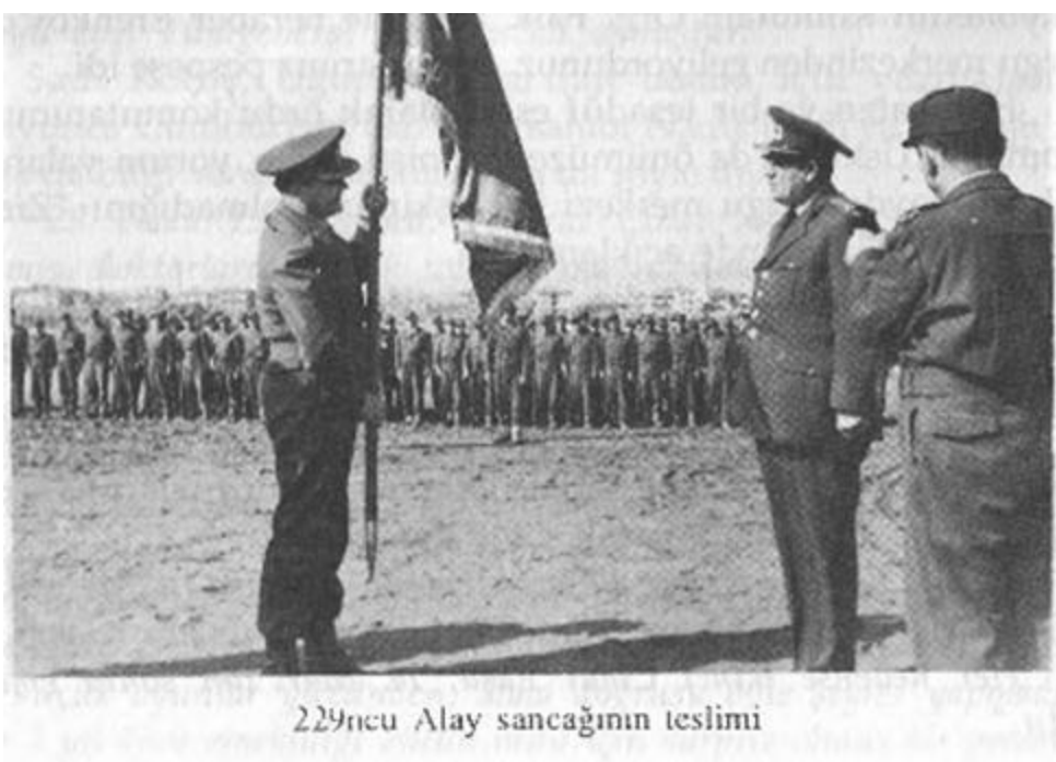
229ncu Alay sancagının teslimi