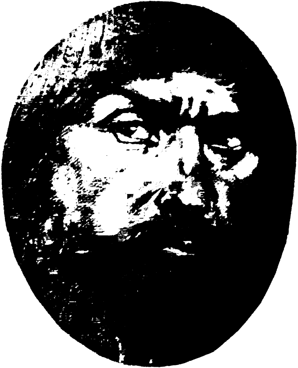
(1797-1871) Büyük Mücâhid Dağıstan Arslanı Şeyh Şâmil