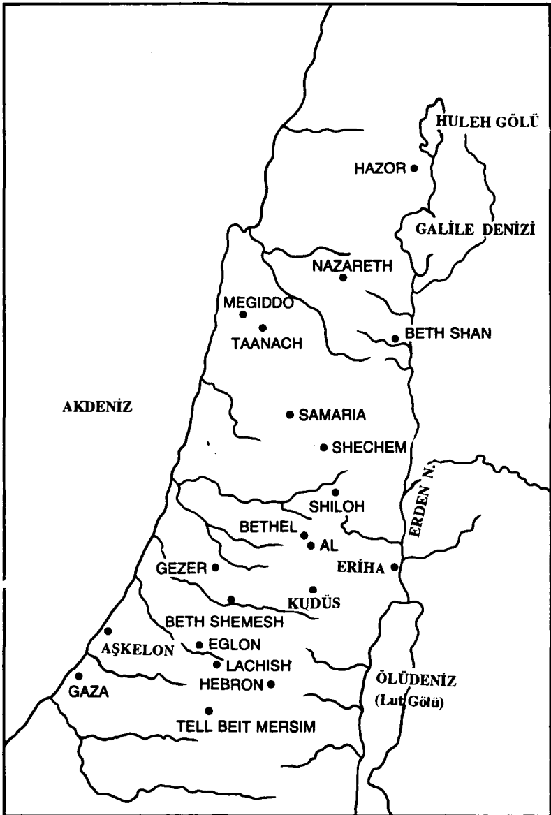
Harita 4: Güney Kenan (Filistin) — Eski Ahit dönemi