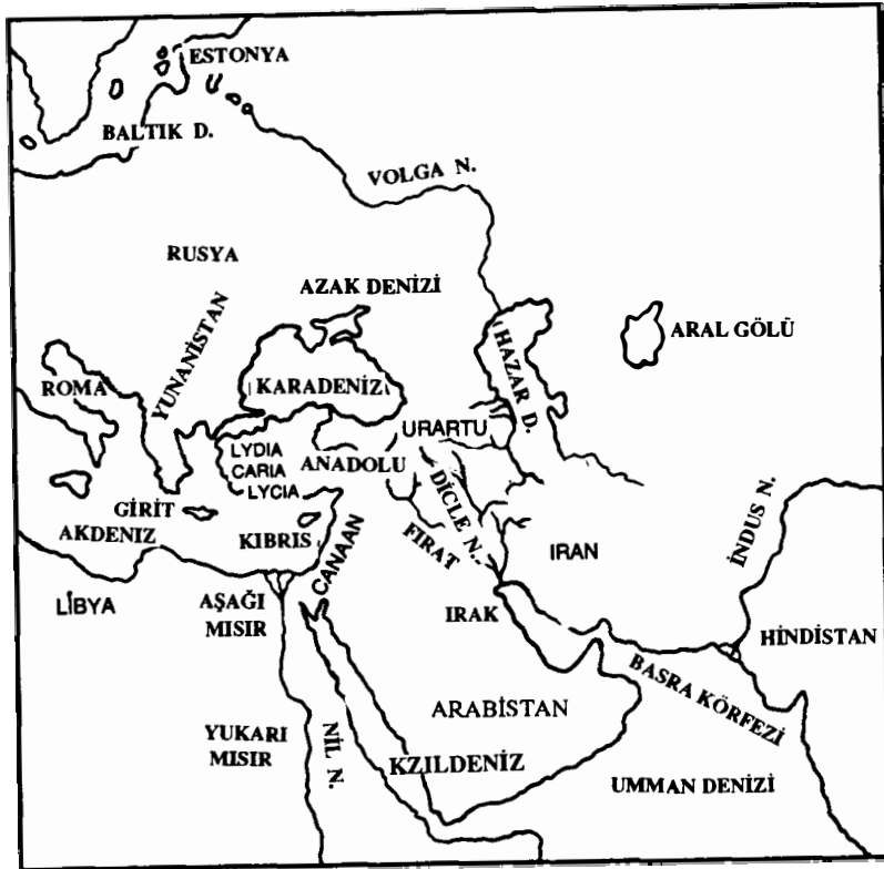
Harita 3: Estonya'dan Basra Körfezi'ne kadar başlıca su yolları

Hint-Avrupalı kavimlerin kültürel atası olarak önceden de sözünü ettiğimiz Maglemosyen ve Kunda kavimleri, ortataş çağında bile "içi oyuk ağaç gövdelerinden" kayıklar kullanıyordu. Bu kayıklar temelde binenlerin oturması için ortaları yakılarak oyulan kütüklerdi. Bu kavimler daha eski dönemlerde kuzey Avrupa'da ve Danimarka'da ya-