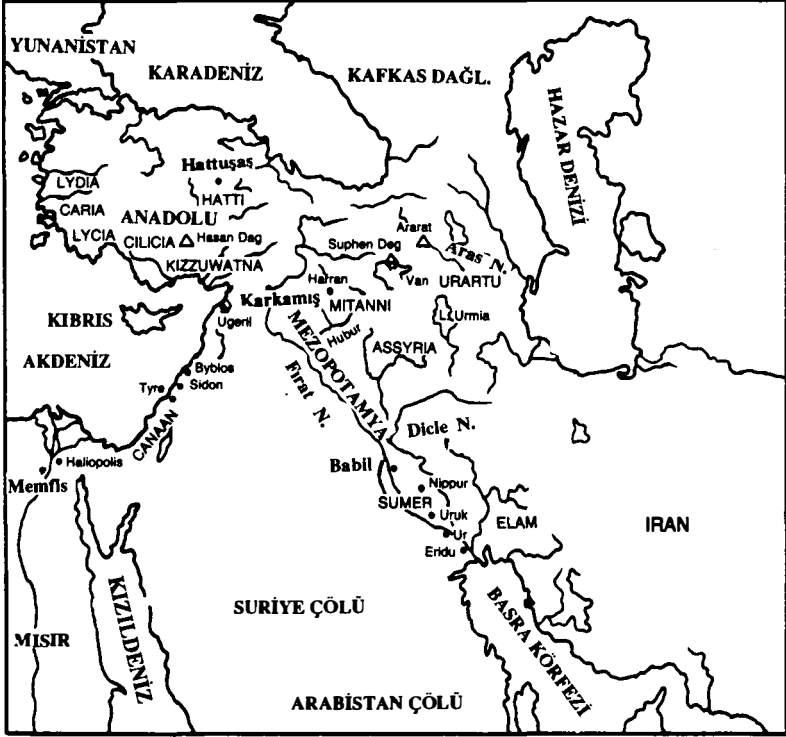
Harita 2: 4. bölümde sözü geçen bölgeler

Megiddo, Kudüs ve Ascalon kentleri, Anadolu'ya ya da Hint-İran'a özgü adlar taşıyan prensler tarafından yönetilmektedir. Daha önceleri Akdeniz'e özgü bir nitelik taşıyan Megiddo'daki kafatası türü, artık Alp özellikleri gösteren kısakafa türüne dönüşmüştür.