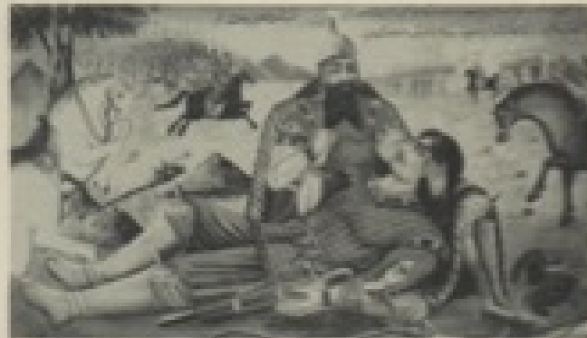
İran halk resmi, Rüstem ve Sührab

Kırmızı Saçlı Kadın 'da okur, Batı'nın ve Doğu'nun iki temel efsanesi Sophokles'in Kral Oidipus 'u (babayı öldürmek) ile Firdavsi'nin " Rüstem ve Sührab "ıyla (oğulu öldürmek) yeniden karşılaşacak ve kendine sıradan hayatlarımızın eski metinlerden ne kadar etkilendiği sorusunu soracak.