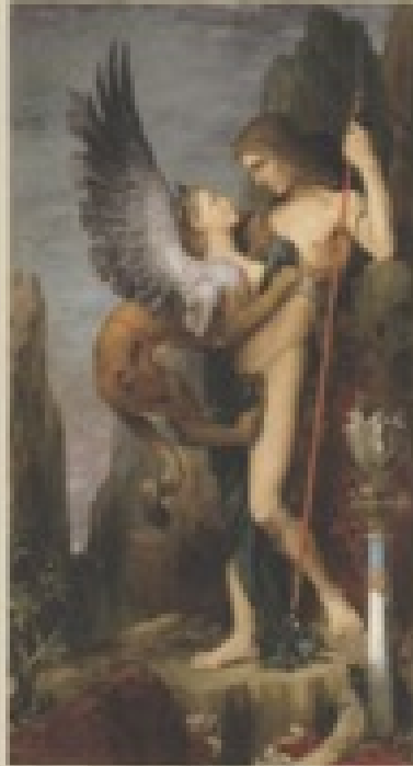
Gustave Moreau, Oedipus or Sphinx

Roman, bir yandan genç kahramanın aşk, kıskançlık, sorumluluk ve özgürlük duygularıyla derinden tanışmasını hikâye ederken, diğer yandan medeniyetler üzerinden babalar ve oğullar, "otoriterlik" ve birey olma konularını tartışıyor.