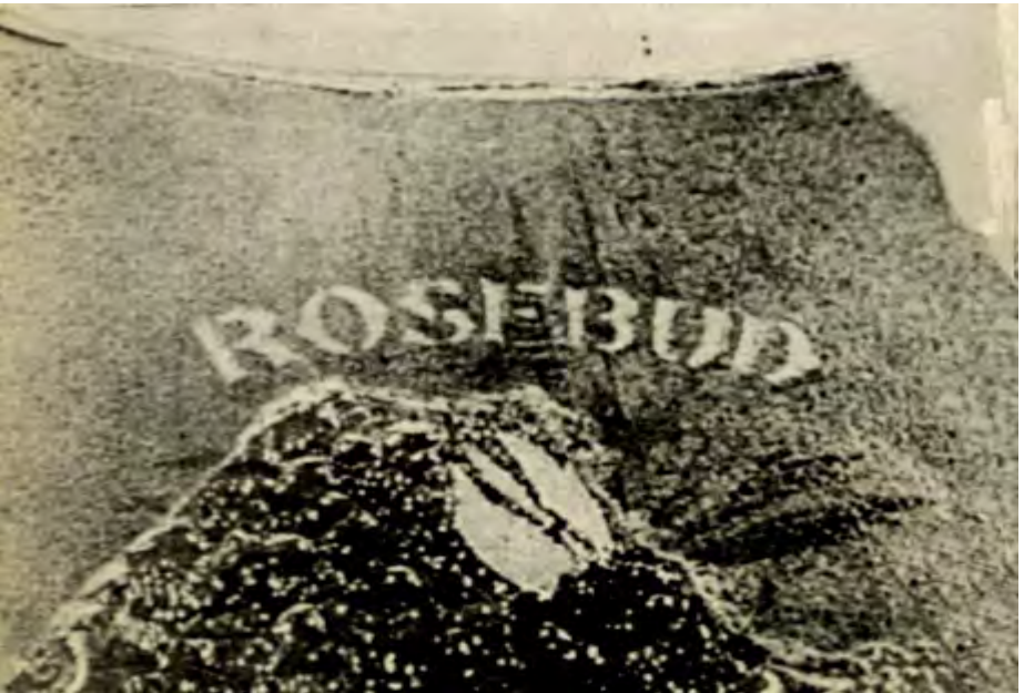
Kane'in çocukken oynadı ı kızak yanarken: "Rosebud'un anahtarı. (s. 185).