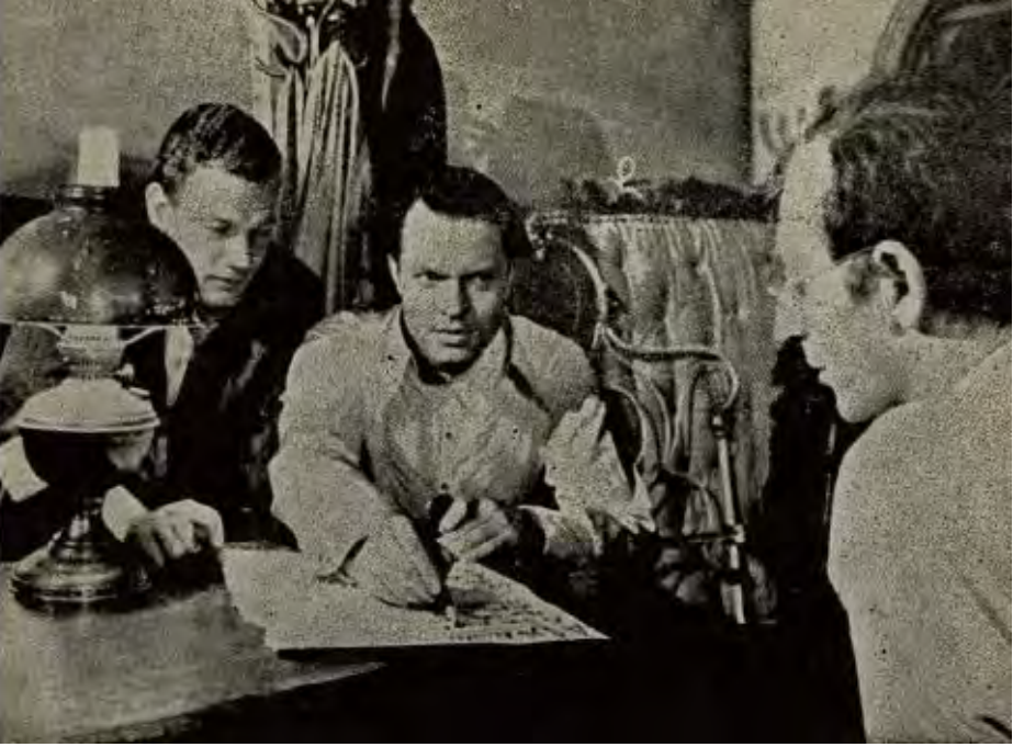
Kane, gazetecilikteki ilkelerini hazırlıyor (s.87).