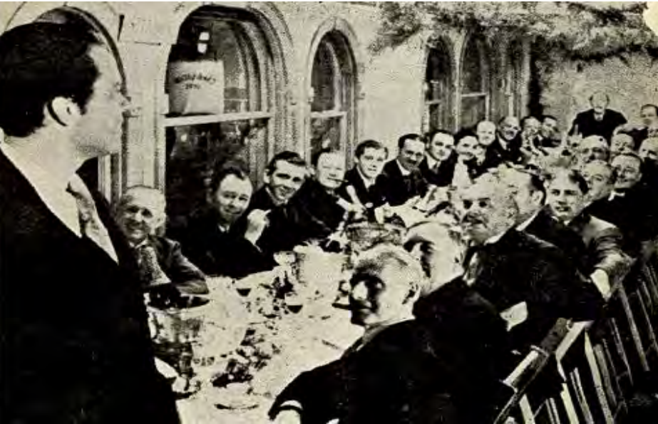
Inquirer mensupları ziyaret masasında (s.92).