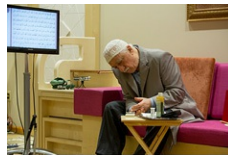
(Bütün rahatsızlıklarına rağmen tedbire riayet ederek oruç tutan muhterem Hocamız, parmağından kan alıp şeker testi yaparken...)