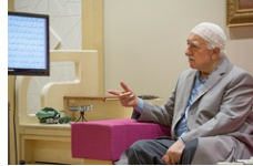
(Muhterem Hocamız sahur ve sabah namazını müteakip tefsir dersinde bir konuyu açıklarken...)

Malının bir kısmını gece bir kısmını gündüz, birazını gizli birazını da açıktan veren Hazreti Ebu Bekir ve Hazreti Ali efendilerimize ittibâen, Hocamız, özellikle Ramazan’da cömertlerden cömert oluyor. Bazen başkalarını da hayra teşvik için ikram u ihsanlarının duyulmasına ses çıkarmıyor fakat çoğu zaman, muhtaç olduğunu zannettiği birine kimsenin görmeyeceği anları kollayarak yardım ediyor hatta bir başkasının eliyle onun ihtiyaçlarını gidererek kendisi işin içinde hiç yokmuş gibi davranıyor. Hocaefendi, bu mekânın mutfağında çalışanından ilimle meşgul olanına kadar herkesin hâl ve hatırını soruyor, dertlerine ortak oluyor, gizli-açık ihsanlarından onları da nasiplendiriyor ve bize bu hâliyle de hüsn-ü misal teşkil ediyor.