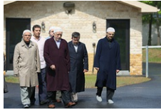
(Hayatı inziva ve itikâfta geçen muhterem Hocamız, aylar sonra bahçeye çıkıp biraz yürüdü, kameriyede kısacık hasbihal etti.)

Hâsılı, Hocamızın ifadesiyle, şu son dönemde zaman bizim için hep muharrem, zemin Kerbela oldu. Sinemiz, Hüseyin’in âh u efgânıyla inledi; gözlerimiz karararan ufuklarda, hilal arar gibi bir ışık gözledi. Hocaefendi, kalbinin ritmini bozan ve birkaç defa hastaneye gitmeye mecbur bırakan hadiseler karşısında bile her şeye rağmen sabra sarılmak gerektiğini ifade etti; “Sabır, sabırdan daha ağırına katlanacağımı anlayıncaya kadar sabredeceğim.” dedi. Yaklaşık bir sene bahçeye bile çıkmadı; kendisini Hakk’a teveccühe ve münacata verdi; dostlarını küllî duaya çağırdı, belalar için paratoner olan sadakaya teşvik etti. Sabırda tavsiyeleşmek, zorlukları yenmek için yardımlaşmak ve mü’mine yakışan üslubu mutlaka korumak gerektiğini vurguladı.