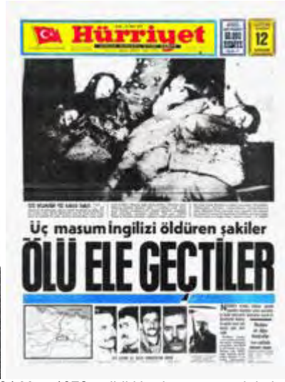
31 Mart 1972 tarihli Hürriyet gazetesinin baş sayfası

Mahir Çayan (15 Mart 1945 - 30 Mart 1972), Türkiye Halk Kurtuluş Partisi-Cephesi lideri. Marksist-Leninist devrimci önder. 30 Mart 1972 tarihinde, Tokat'ın Niksar ilçesine bağlı Kızıldere Köyü'nde askerle girdiği çatışmada dokuz arkadaşıyla birlikte öldürüldü.