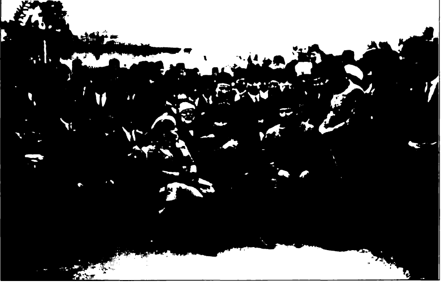
Salih Bozok, bir yurt gezisinde Latife Hanım ve Mustafa Kemal'le.