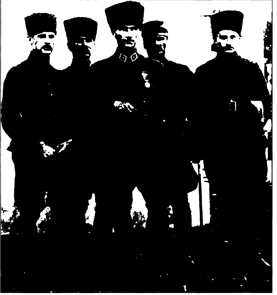
Mustafa Kemal'le Kurtuluş Savaşı'nda. Hep sağ omzunun hemen üzerinde...