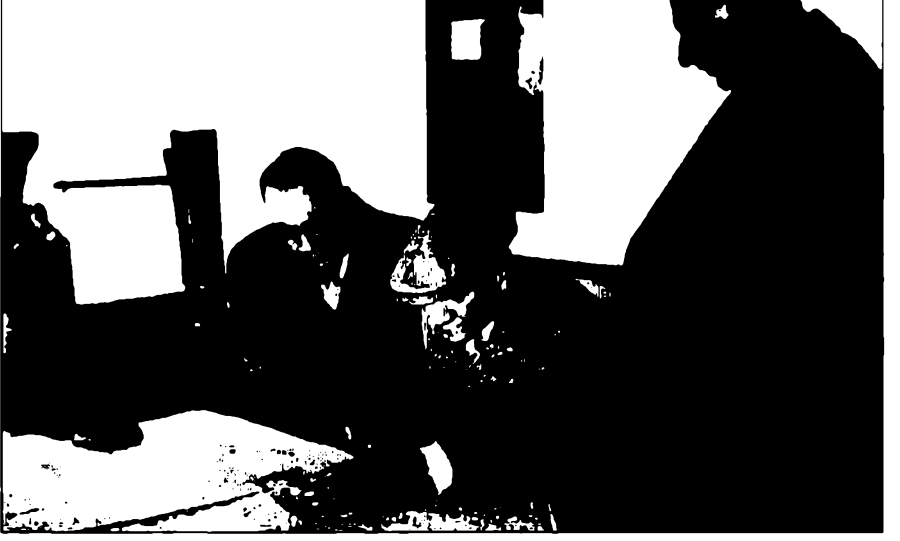
Mustafa Kemal Atatürk harita başında...