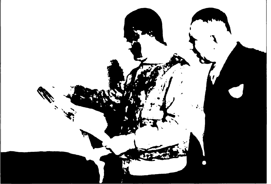
Atatürk'le bir gazete mütalaasında: hep Atatürk'ün yanında...