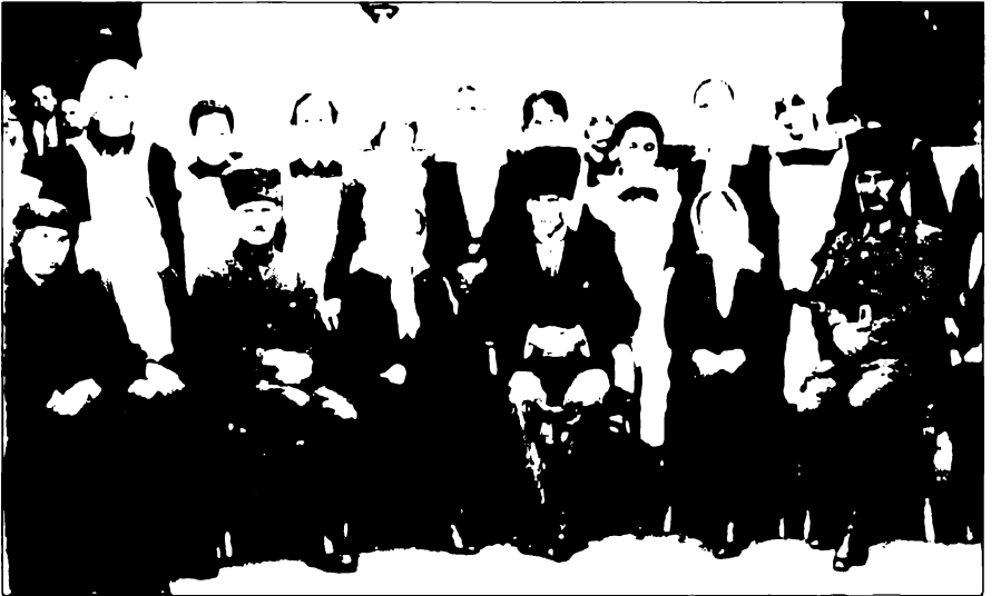
Mustafa Kemal ve Salih Bozok hemşirelerle.