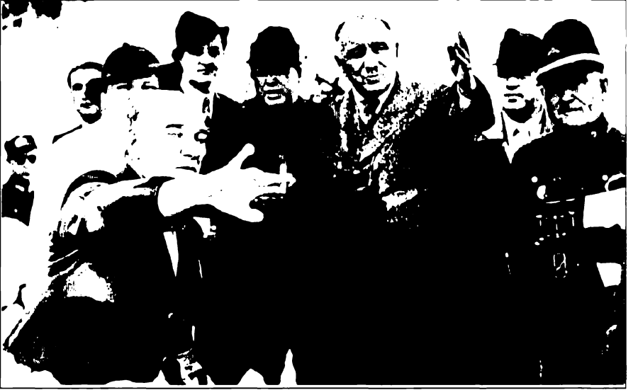
Atatürk ve Salih Bozok bir askeri manevrada: "İşte Paşam, askeriniz!.."