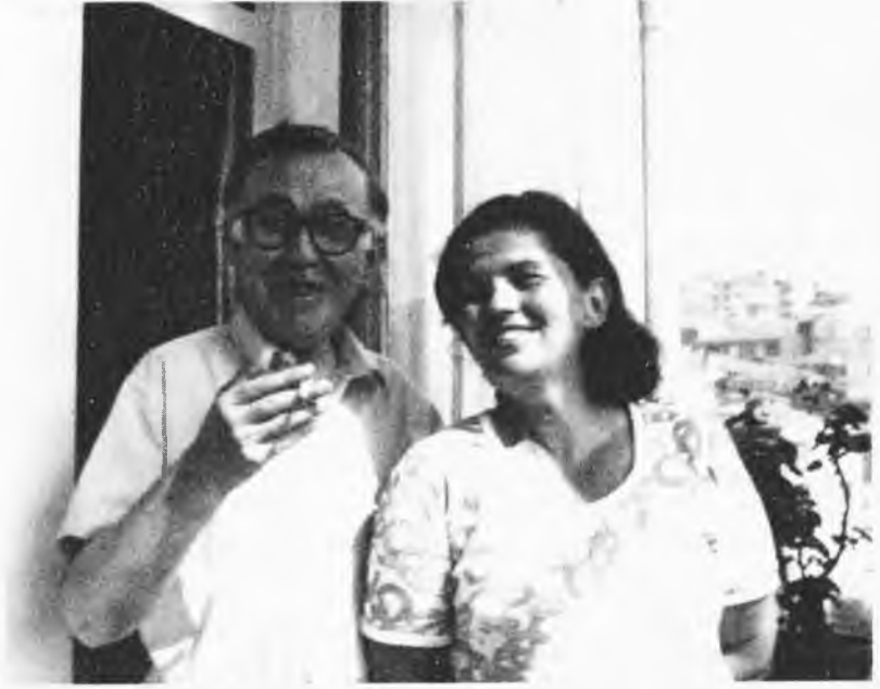
Beşiktaş, Nüzhetiye caddesindeki evinin balkonunda (Temmuz 1974).