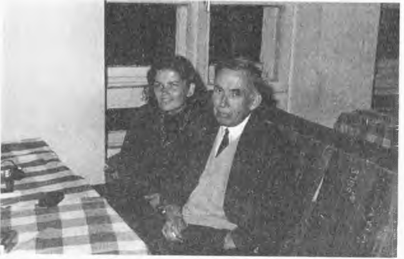
Bursa Uludağ, Beceren Oteli'nde (Eylül 1968).