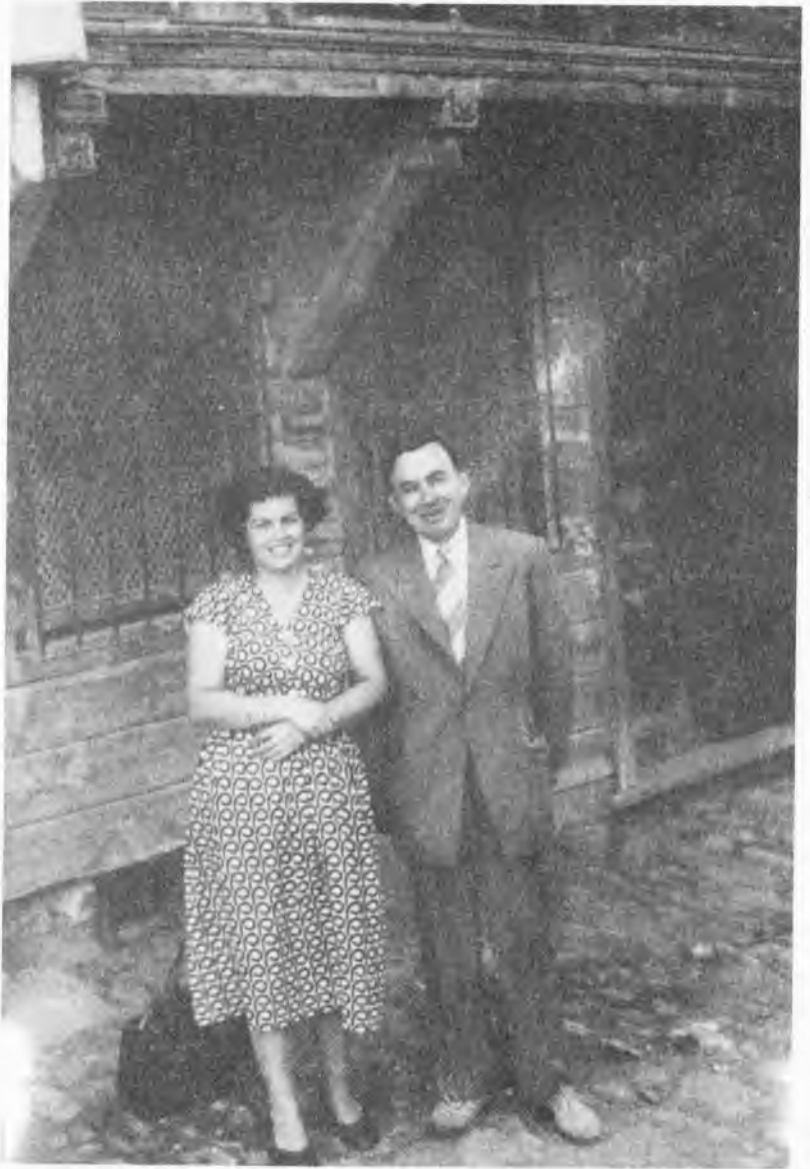
Valideçeşme. Setüstü Sokak, 22 no'lu ilk evlerinin önünde eşi ile birlikte (1950).