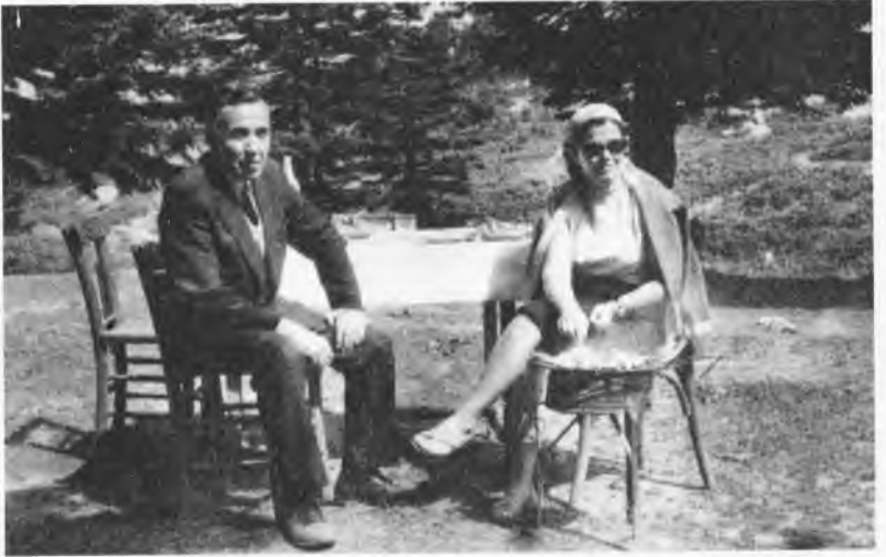
Bursa Uludağ, Sarıalan'da et-mangal (14 Eylül 1968).