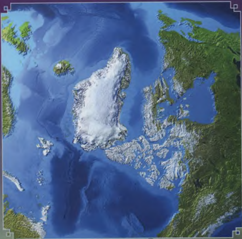
Kuzey Kutup Dairesi'nin havadan görünümü.