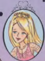
Kıtap 6 Prenses Emily