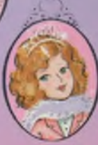
Kıtap 2 Prenses Marie