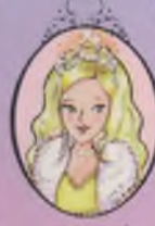
Kıtap 5 Prenses Sophia