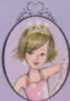
Kıtap 1 Prenses Charlotte