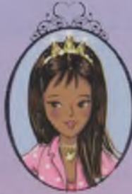
Kıtap 4 Prenses Daisy