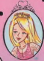
Kitap 6 Prenses Emily