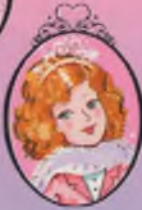
Kitap 2 Prenses Katie