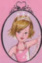
Kitap 1 Prenses Charlotte

Hayır olamaz! Eğer Prenses Alice Merdivenleri Havada Süzülür Gibi İnme Sınavı'nı geçemezse Prenses Okulu'ndaki Bahçe Partisi'ne katılmasına izin verilmeyecek ve Sihirli Ayna'yı da göremeyecek. Bakalım ona kim yardım edecek?