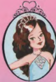
Kitap 4 Prenses Alice