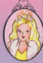
Kitap 5 Prenses Sophia