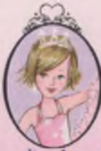
Kitap 1 Prenses Charlotte

Genç ve güzel bir Peri Anne adayı Prenses Okulu'na gelince Prenses Emily çok seviniyor. Yıl Sonu Balosu'na birkaç gün kala bazı dilekler çok işe yarayabilir. Ancak Peri Angora sihir konusunda pek de başarılı sayılmaz!