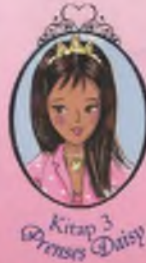
Kitap 3 Prenses Daisy