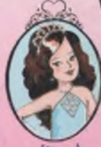
Kitap 4 Prenses Alice