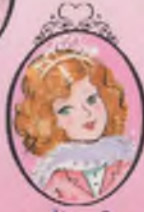
Kitap 2 Prenses Karim