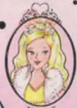
Kitap 5 Prenses Sophia