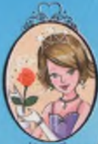
Kitap 7 Prenses Charlotte

Prenses Katie çok heyecanlı. Gerçek bir cadıyla tanışmak için okul gezisine çıkacaklar! Ama Cadı Rüzgargülü, Katie ve arkadaşlarından sihirli bir iksir yapmalarını istediğinde korkunç bir sürpriz onları bekliyor olacak.