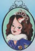
Kitap 10 Prenses Alice