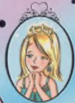
Kitap 12 Prenses Emily