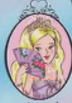
Kitap 11 Prenses Sophia