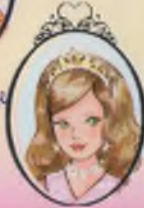
Kitap 15 Prenseler Georgia