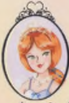
Kitap 13 Prenseler Chloe

Prenseler Okulu Arkadaşlık Festivali düzenliyor! Prenses Jessica, Gelincik Odası'ndaki arkadaşları için özel bir şeyler yapmak istiyor. Peki ya korkunç Prenses Diamonde her şeyi mahvederse?