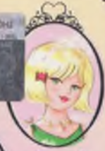
Kitap 18 Prenseler Amy