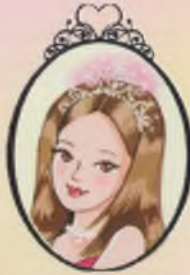
Kitap 16 Prenseler Olivia