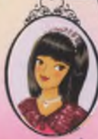
Kitap 17 Prenseler Lauren