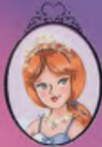
Kitap 13 Prenses Chloe