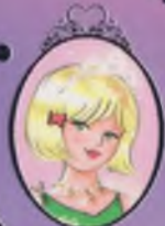
Kitap 18 Prenses Amy