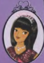
Kitap 17 Prenses Lauren