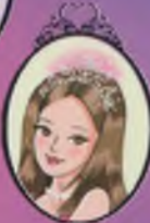
Kitap 14 Prenses Gisela