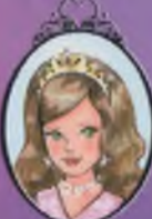
Kitap 15 Prenses Georgia