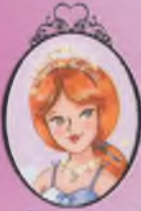
Kitap 13 Prenses Chloe

Prenses Amy, dönem sonu dans yarışması nedeniyle çok heyecanlı! Bakalım Yakut Kuşağını alacak kadar taç puan kazanıp muhteşem altın arabada seyahat edebilecek mi?