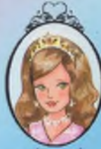
Kitap 15 Prenses Georgia