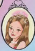
Kitap 14 Prenses Jessica