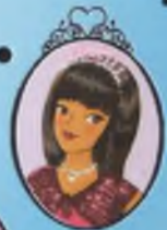
Kitap 17 Prenses Lauren